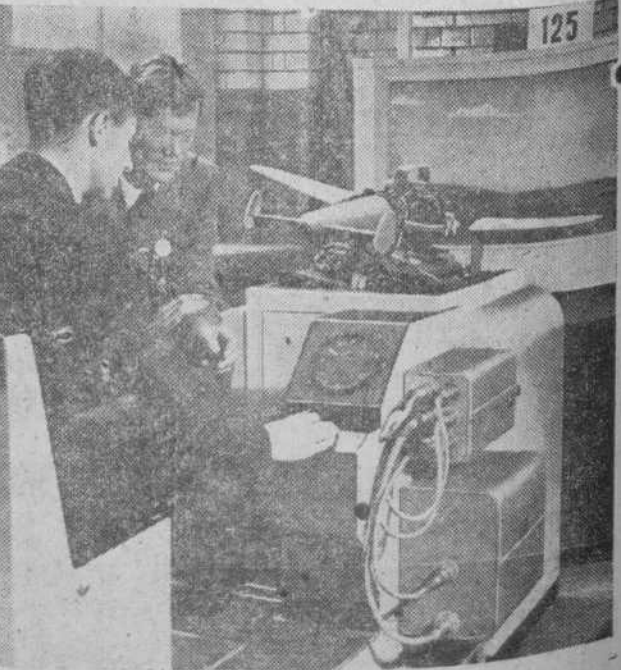
Ya hemos oído hablar mucho de los aviones dirigidos por radio. He aquí en la "foto" la sencilla manera de hacerlo, pero utilizando para la prueba un pequeño, como si se tratara de un juguete.