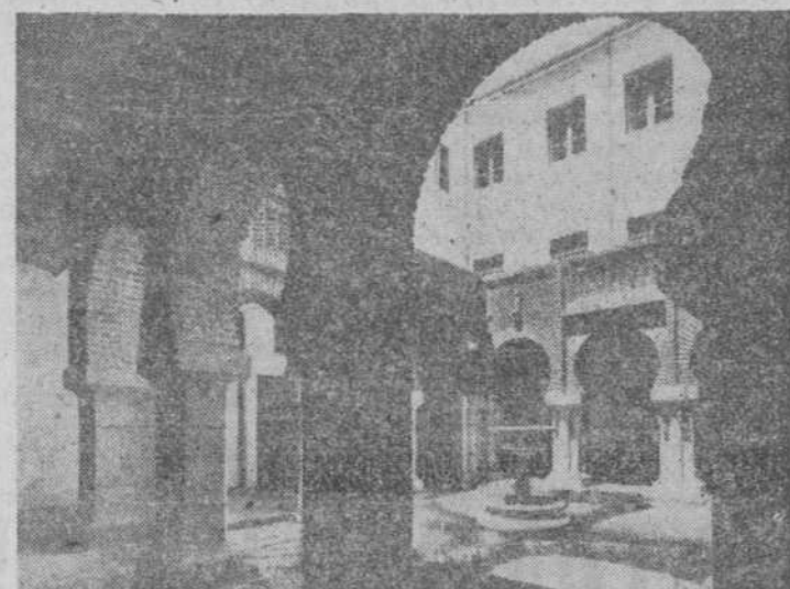
Una vista del Claustro

Convento y Colegio unieron sus glorias a la vida de la Universidad y al esplendor de la Orden, ocupando lugar distinguido en la historia de Salamanca. Sabios maestros y escritores profundos brotan de sus claustros, y los nombres gloriosos de fray Domingo de San Juan de Pie del Puerto, fray