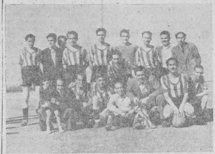
Equipo de EL ADELANTO y "La Gaceta" que inició el "combate" de ayer contra la selección de Artes Gráficas

Con más voluntad que facultades, los "muchachos" de EL ADELANTO, reforzados con algunos elementos de "La Gaceta"