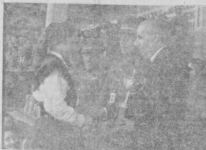
El Rector de la Universidad, entregando una de las copas, premio en las competiciones celebradas