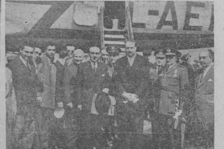
Los ministros de Asuntos Exteriores, del Líbano, señor Dilpita Takla Bey, y de España, señor Martín Artajo, con otras personalidades, que han acudido a recibir al primero, a su llegada al aeropuerto de Barajas