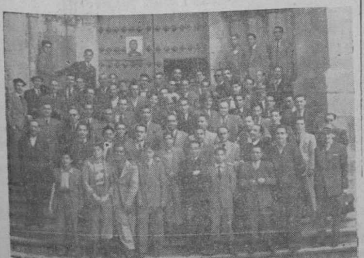
Los asistentes a la misa congregados a la puerta del templo parroquial de San Martín