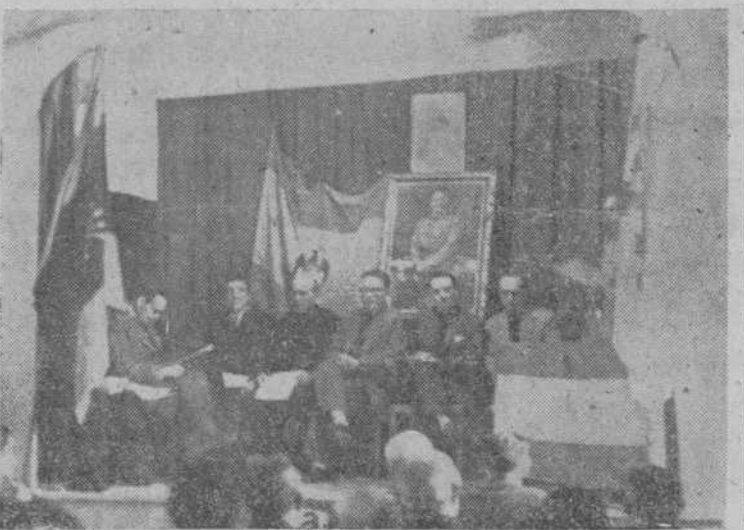
Presidencia de la Asamblea de las Cooperativas del Campo y Cajas rurales