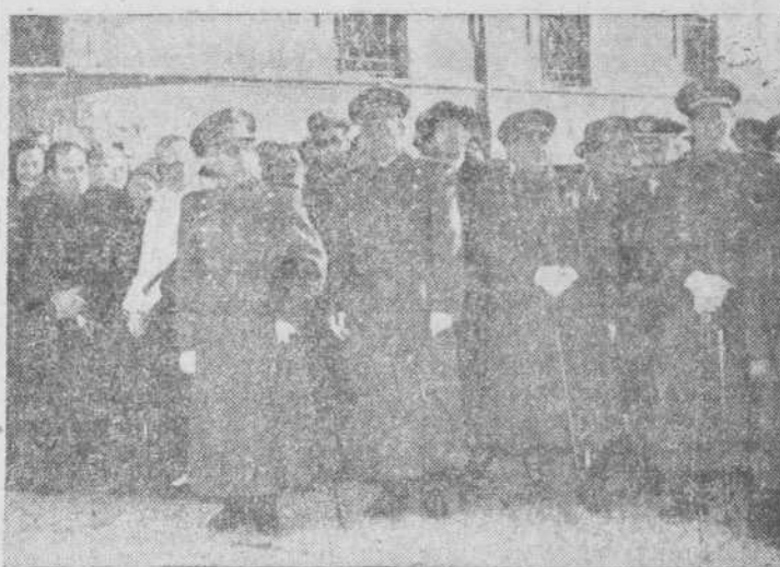
El gobernador militar y autoridades presenciando el desfile en la Plaza de Anaya.

La presidencia militar, que se hallaba situada en la parte del Evangelio, fué ocupada por el excelentísimo señor gobernador militar de la Plaza, general don Ricardo Alonso Vega; coronel del Regimiento de Infantería, señor