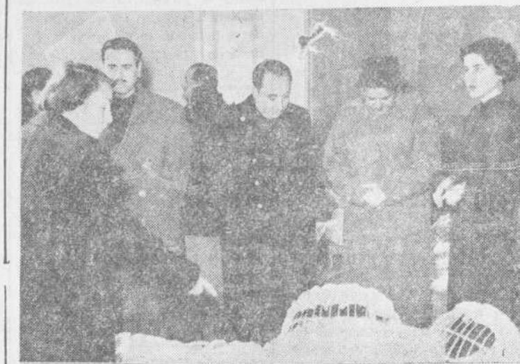
El gobernador civil examinando la Exposición de canastillas de la Sección Femenina.

Es ya tradicional en los finales del año la concesión de canastillas completas y hatillos para los recién nacidos, de familias humildes y para aquellos que nazcan en las proximidades del día de la Natividad del Señor.