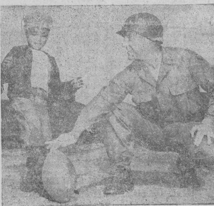
Un niño coreano de cinco años aprende a jugar al fútbol norteamericano (modificación del rugby), ante la sonrisa aprobadora de su entrenador