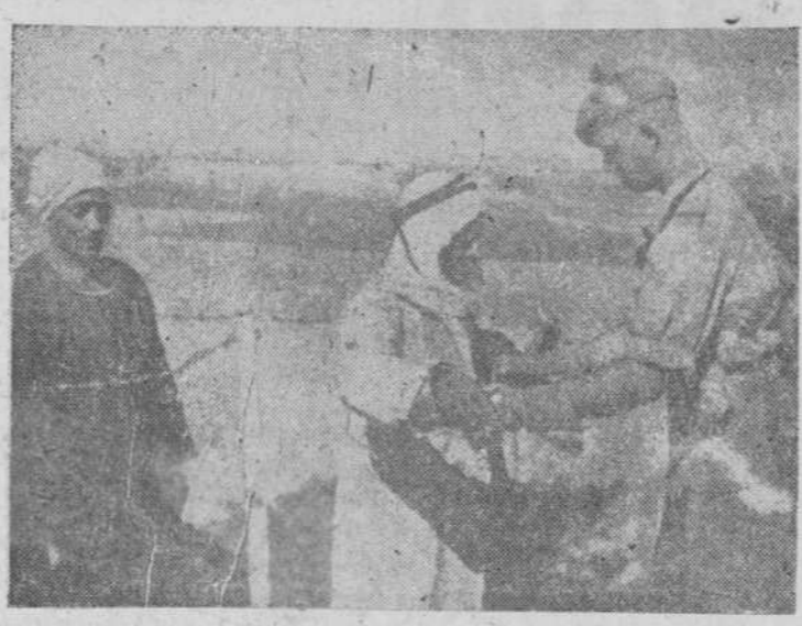
A la entrada de la zona del Canal de Suez, ocupada por los soldados británicos, se cachea a los indígenas que pretenden atravesar aquella zona, como precaución ante los sucesos ocurridos recientemente.