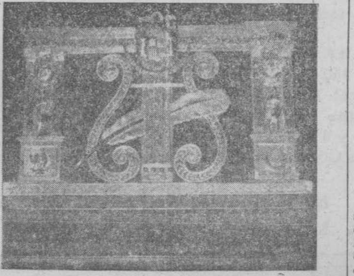
En nuestro número de ayer dábamos cuenta de la ofrenda que en homenaje al maestro Guerrero hicieron los delegados de la Sociedad de Autores. Es este el atril de plata repujada que constituyó la ofrenda.