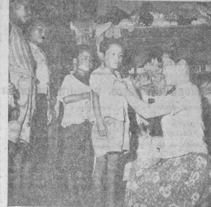
Las mujeres de Seul trabajan voluntariamente en un orfanato a cargo de la Comandancia y del Gobierno coreano. Clasifican y reparten las ropas enviadas por los Estados Unidos

En la república de Corea, arrasada por la guerra, colaboran los organismos de la O. N. U. y del Gobierno coreano en la tarea de socorrer a la población civil. La Comandancia de Ayuda a la Población Civil de la O. N. U. perteneciente al Octavo Ejército norteamericano, está encargada de distribuir lo que envía la O. N. U. y de asesorar a las autoridades locales en lo que respecta al reparto. Hasta la fecha, la Comandancia ha distribuido víveres y efectos por valor de más de cincuenta y ocho millones de dólares. A ella se debe también que haya menos víctimas de las enfermedades contagiosas entre los refugiados. El setenta por ciento de los habitantes de la república han sido vacunados contra la viruela, el tifus y las fiebres tifoideas. Se está terminando un programa de inmunización contra el cólera.