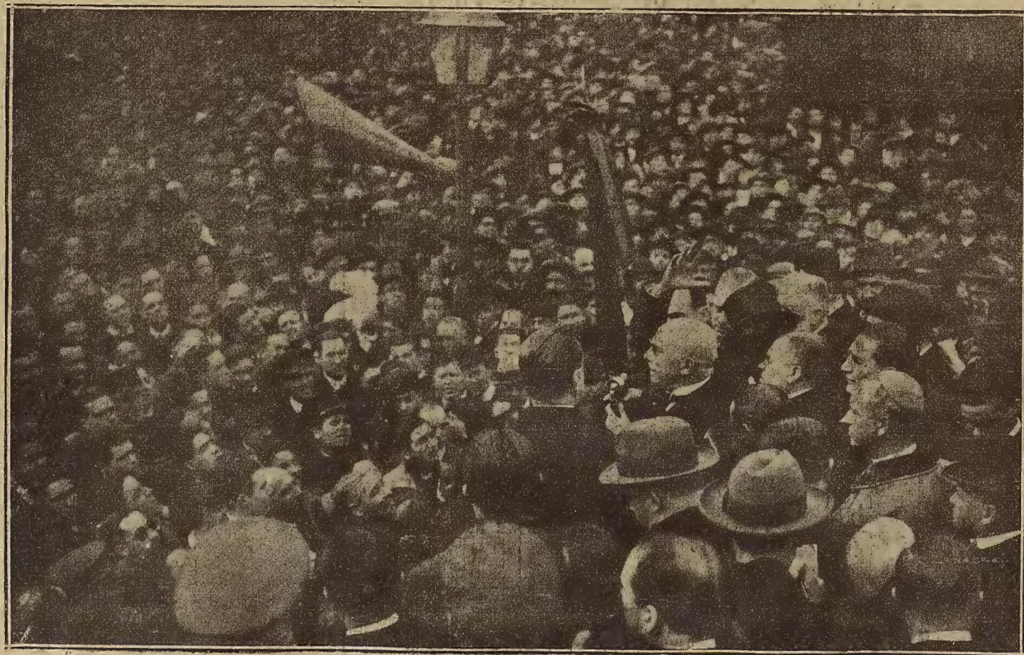
MADRID: IMPONENTE MANIFESTACION CON MOTIVO DE HABER LLEGADO EL «PLUS ULTRA» A BUENOS AIRES.—El embajador de la Argentina, doctor Estrada, en su vibrante discurso de confraternidad hispanoamericana.