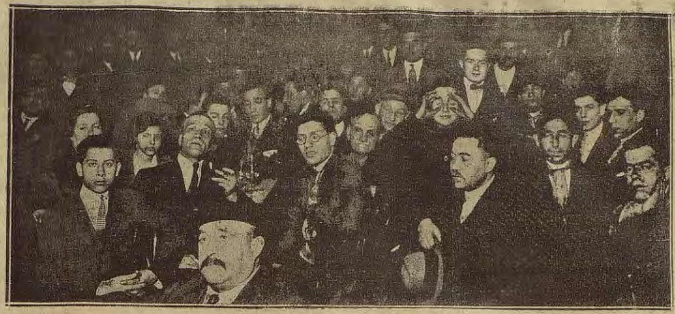
EL ANIVERSARIO DE LA PROCLAMACION DE LA REPUBLICA EN ESPANA.—Un aspecto del salón del Centro republicano de la calle de los Estebanes durante la fiesta conmemorativa celebrada anteanochir