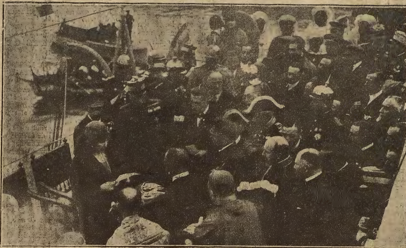
MALAGA.— La reina doña Victoria leyendo un discurso en el acto de entrega de la bandera regalada por la ciudad al cañonero «Cánovas del Castillo»

«Nube perfumada» se posa en una banqueta de patas retorcidas y con calados. Su