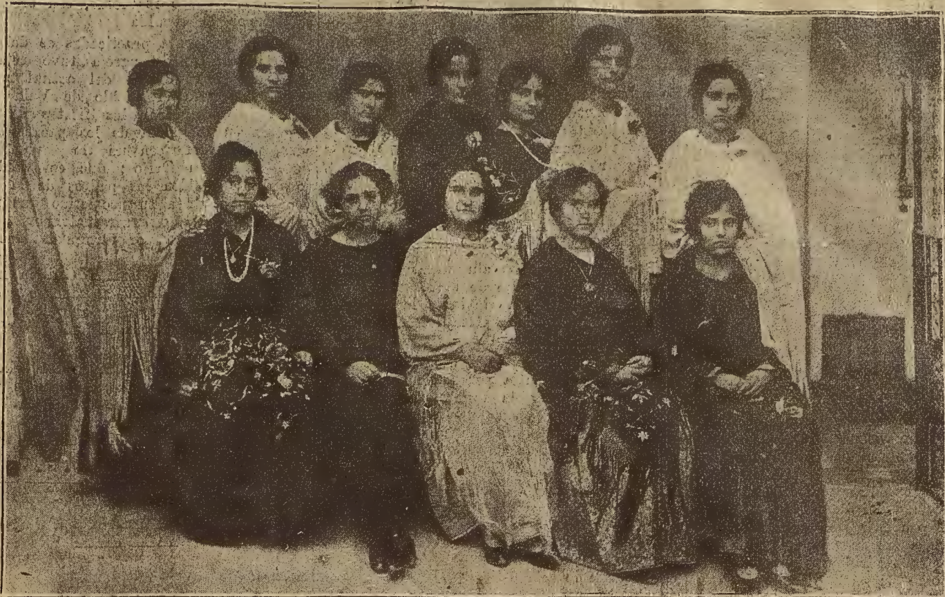
EN MAS DE LAS MATAS:--Señoritas que tomaron parte activa en la fiesta de San Antonio últimamente celebrada en aquella villa.

Poderes públicos en momentos como éstos que estima también decisivos, haciendo calurosa defensa de la Prensa, tanto regional como de nuestra hermana Navarra, a la que se debe tributo de agradecimiento y merece se le reserve un puesto en todo.