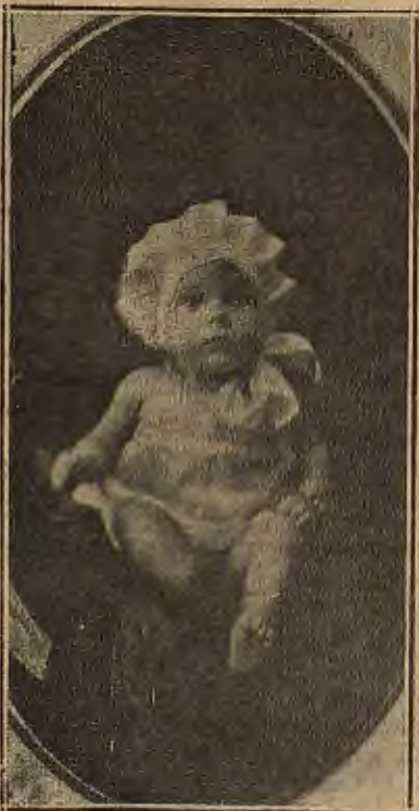
Felicidad E spl Fardos