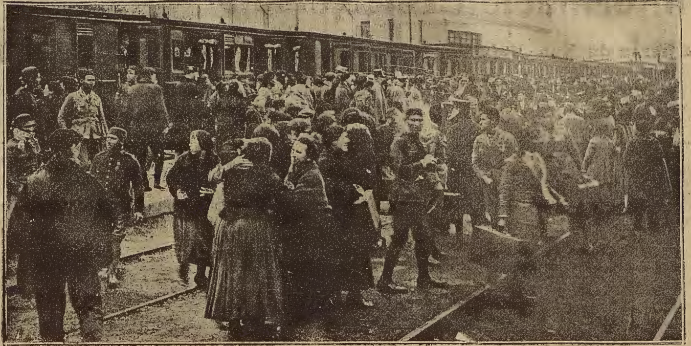
LOS LICENCIADOS LLEGAN.—MOMENTO DE LLEGAR EL TREN ESPECIAL QUE CONDUJO A ZARAGOZA A LOS SOLDADOS QUE PERTENECIERON A LOS CUERPOS DE GUARNICION EN AFRICA Y QUE REGRESAN LICENCIADOS A SUS HOGARES (Fotografía de la Barrera). (Fotografiado LA VOZ DE ARAGÓN)

Hubo en los dos tiempos un marcado dominio del Iberia, que se reflejó, naturalmente, en el resultado apuntado.