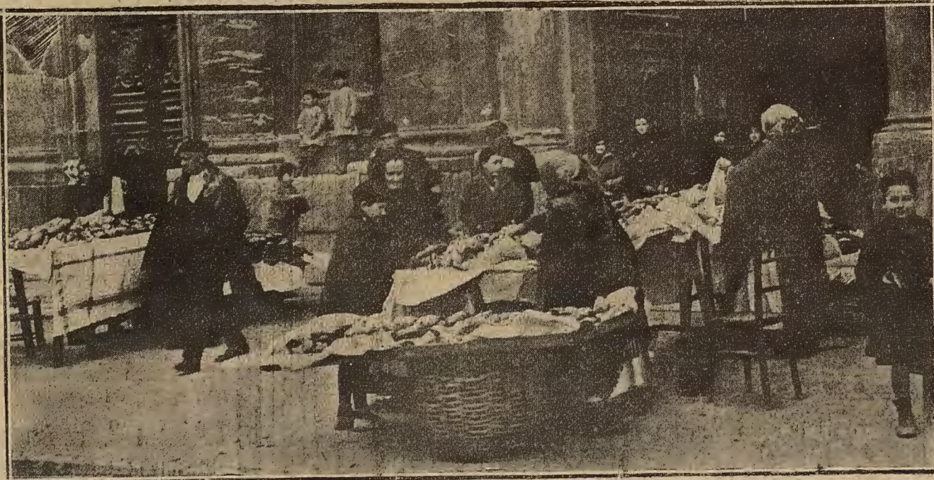
NOTA CALLEJERA LOCAL: EL DIA D.E. SAN VADERO.—LA VENTA DE ROSCONES EN LA PLAZA DE LA SEO.