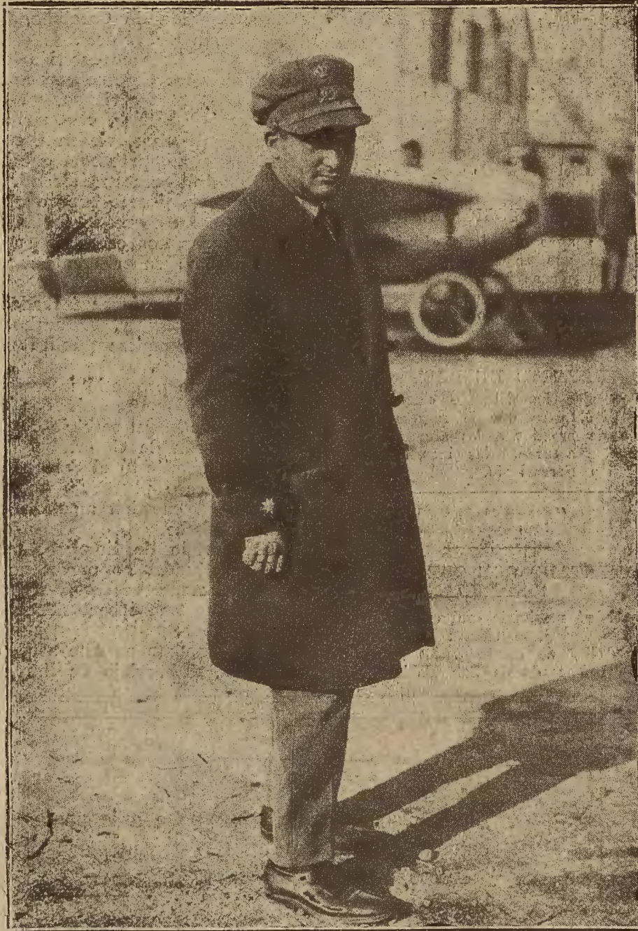
FIGURA DE ACTUALIDAD.—EL COMANDANTE FRANCO, QUE EN BREVE INTENTARÁ EL «RAID» DE AVIACION CADIZ-BUENOS AIRES.

los países que han recurrido a borrar la constitución para resolver los problemas que inquietaban su vida interior, les atrae de una manera irresistible.