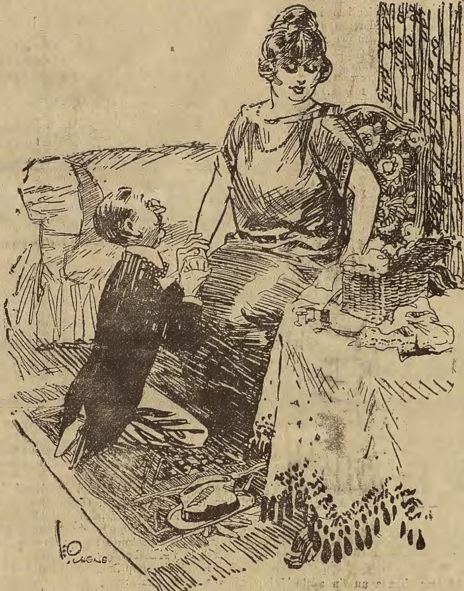
UNA MUJER PRACTICA

—No señor; no puedo darle mi mano. Pero ya que está usted arrodillado ¿querría recogerme el dedal que ha caído debajo de la mesa?