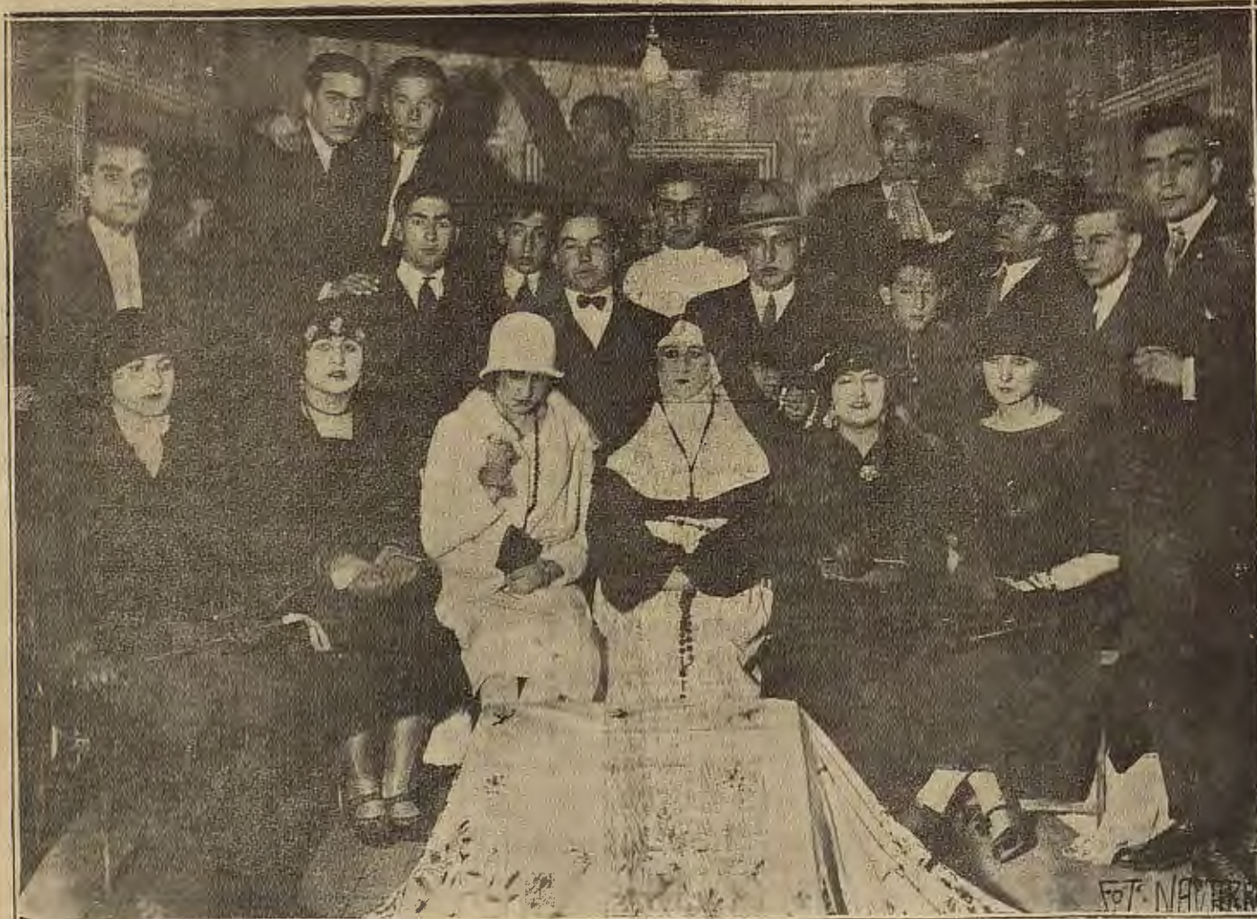
LA ALMUNIA DE DONA GODINA.—SEÑORITAS Y MUCHACHOS QUE TOMARON PARTE EN LA VELADA ARTÍSTICA QUE ORGANIZO EL CASINO PRINCIPAL.