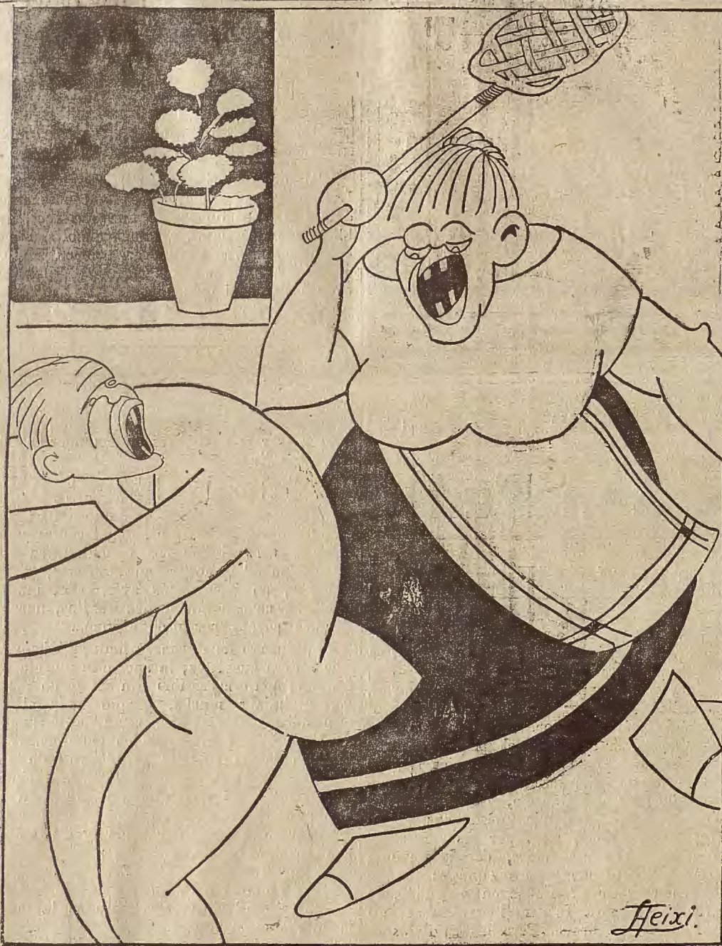
NOTA VERANIEGA.— La hora del «baño».

faroles, en rápida marcha del auto, acaso un transeunte diga, a los que toman brebajes de colores en la terraza del Café de Francia, digan guiñando un ojo: