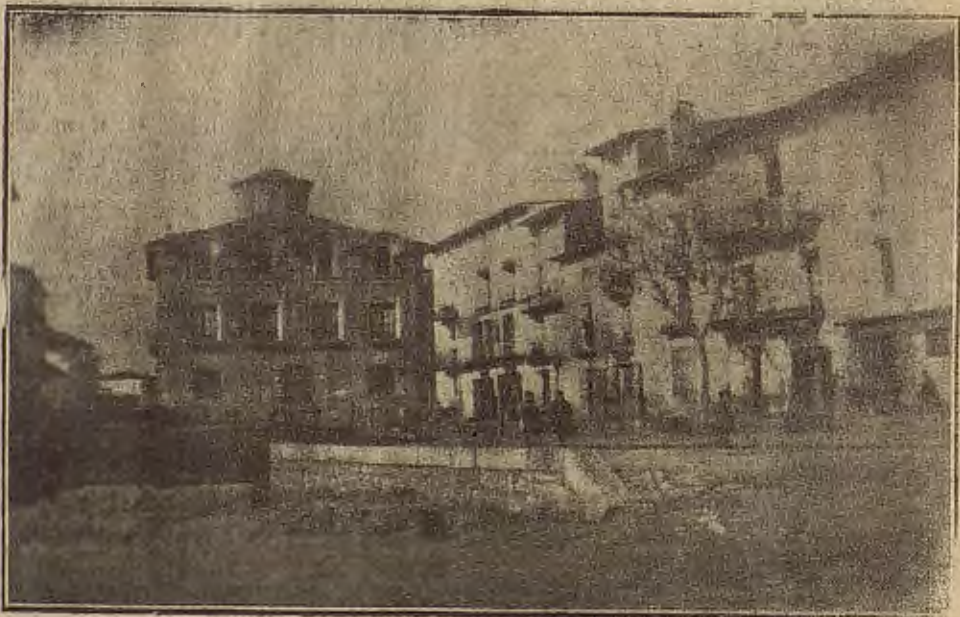
NOTAS GRAFICAS DE LA REGION.—Plaza de las Acacias, de Villarroya de la Sierra. Al fondo la llamada Casa Grande.

Terminadas las fiestas de San Antonio, empezó el desfile de forasteros, con lo cual el pueblo ha recobrado su aspecto de normalidad y calma. No todos se marcharon, pues hubo algunos que, dada la proximidad de las fiestas de San Pedro, nuestro Patrón, decidieron quedarse entre nosotros. Les alabamos el gusto. —R. ANDREU PASCUAL