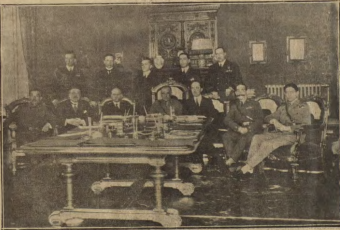
MADRID: LA CONFERENCIA FRANCO-ESPAÑOLA PARA EL ARREGLO DEL PROBLEMA DE MARRUECOS.—Los comisionados de Francia y España, reunidos por primera vez bajo la presidencia del general Gómez Jordana.