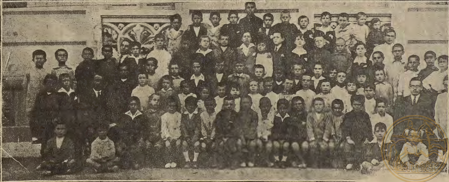
VISITA OFICIAL A LAS EXPOSICIONES ESCOLARES. —Las niñas y niños de la escuela de Torrero

INSTITUTO DE ESTUDIOS ARAGONESES