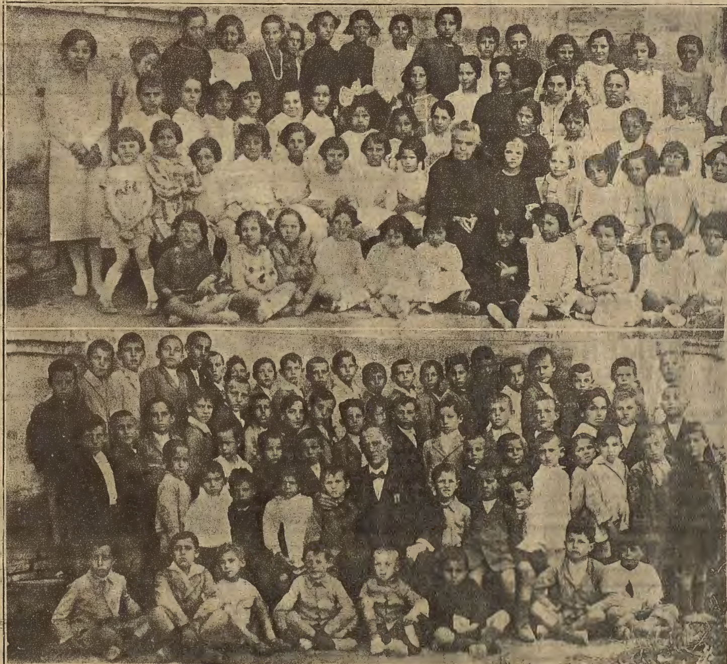
VISITA OFICIAL A LAS EXPOSICIONES ESCOLARES.—Las niñas y los niños de la escuela de Casablanca