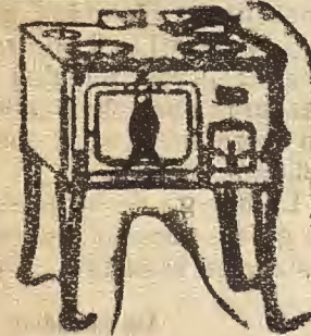
Ha trasladado sus talleres por ampliación de negocio a la calle Mayor, núm. 61.

de todos los tamaños y diferentes modelos para carbón y leña, con depósito de Hierro Fundido Esmaltado, cocinas para serrín, termosifones, etc.