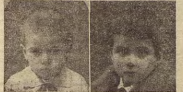
6 meses tratamiento

Del 1927 al 1936, curados más de 150.000 casos. Distinguido con las más altas recompensas. Nomenclamiento de miembro honorario del Jurado de Sanidad de Francia y Londres. Registrado en el Instituto Técnico de Comprobación con el número 12,276 e internacional.