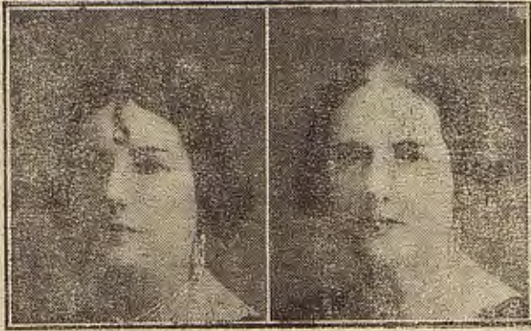
10 meses curada, sin pelucas