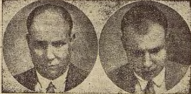
8 años calvo 5 meses tratamiento

EL REJUVENECIMIENTO DE LA FISONOMIA HUMANA ¡NO MAS CALVOS! Hechos y no palabras