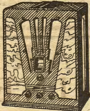
Modelo 265 para onda normal y larga

Así hablan los felices poseedores de un PHILCO, el único aparato que por su fidelidad y pureza de tono ha sido proclamado "Un instrumento musical de calidad" en todo el mundo.