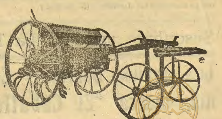
Sembradora-abonadora con avantren, marca LABAD

Fabricantes: Labad, Mur y Compañía S. L. Plaza de Doña Sancho, 3. Teléfono núm. 258-R HUESCA