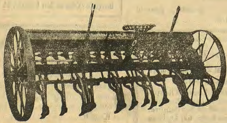
Sembradora LABAD, patentada. Tipo de Tractor para siembra a chorrillo