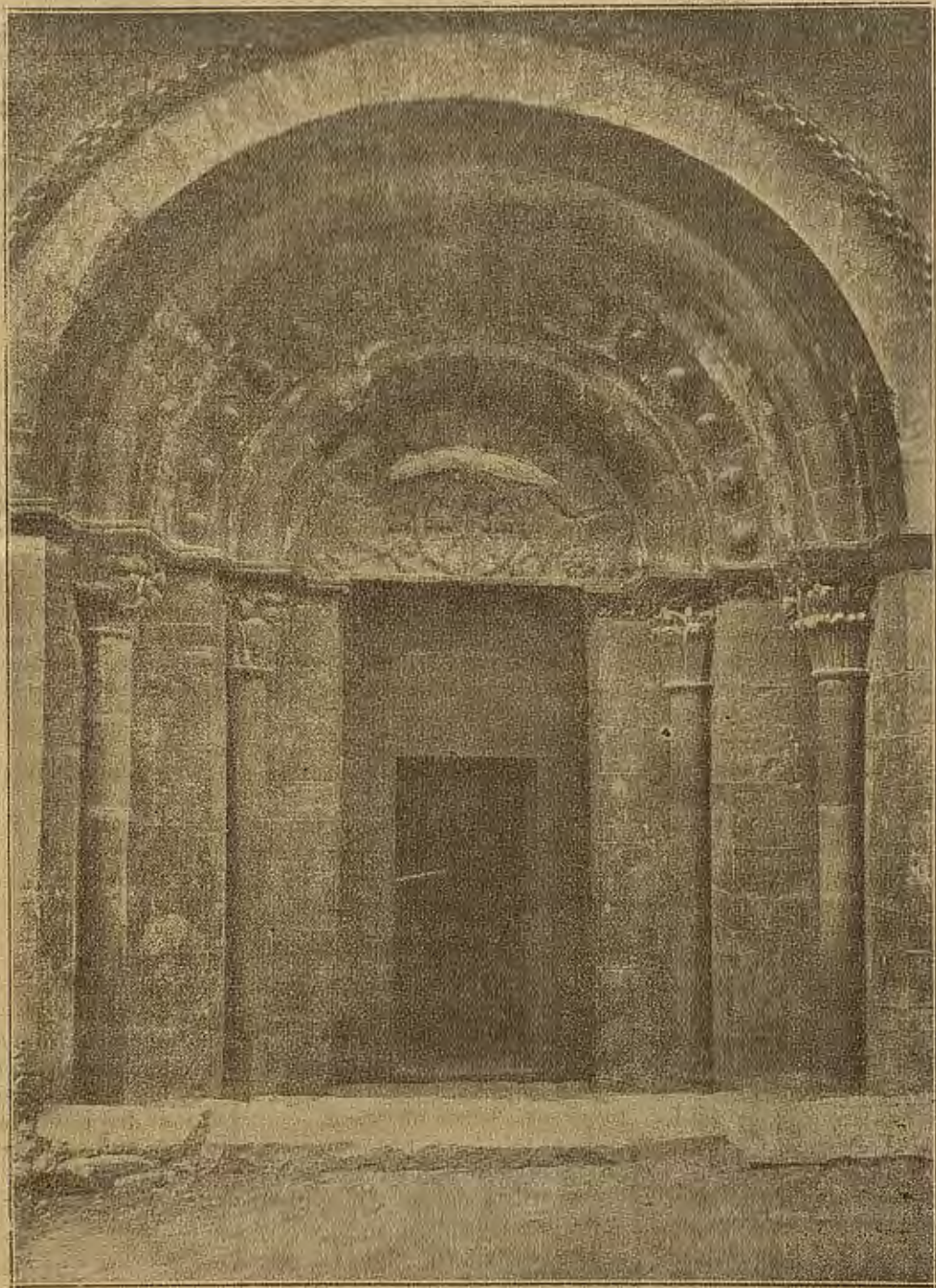
Santa Cruz de la Serós. Portada de la Iglesia del Monasterio

Jaca, magnífica residencia veraniega y Universidad de verano con cursos para extranjeros que duran de 1.º de Julio a 31 de Agosto.