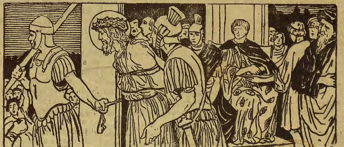
Del Via Crucis.—Pilatos entrega a Jesús a los verdugos