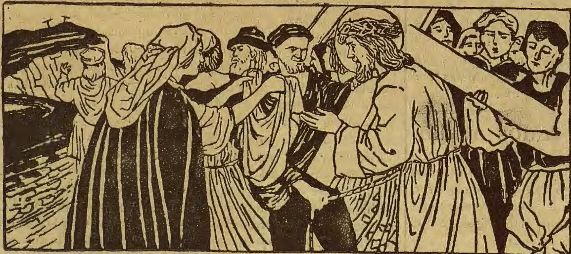
Del Via Crucis.—Encuentro de Jesús con la Verónica

Mas añadió luego Jesucristo: «En verdad, en verdad os digo, que no es el siervo más que su amo: ni