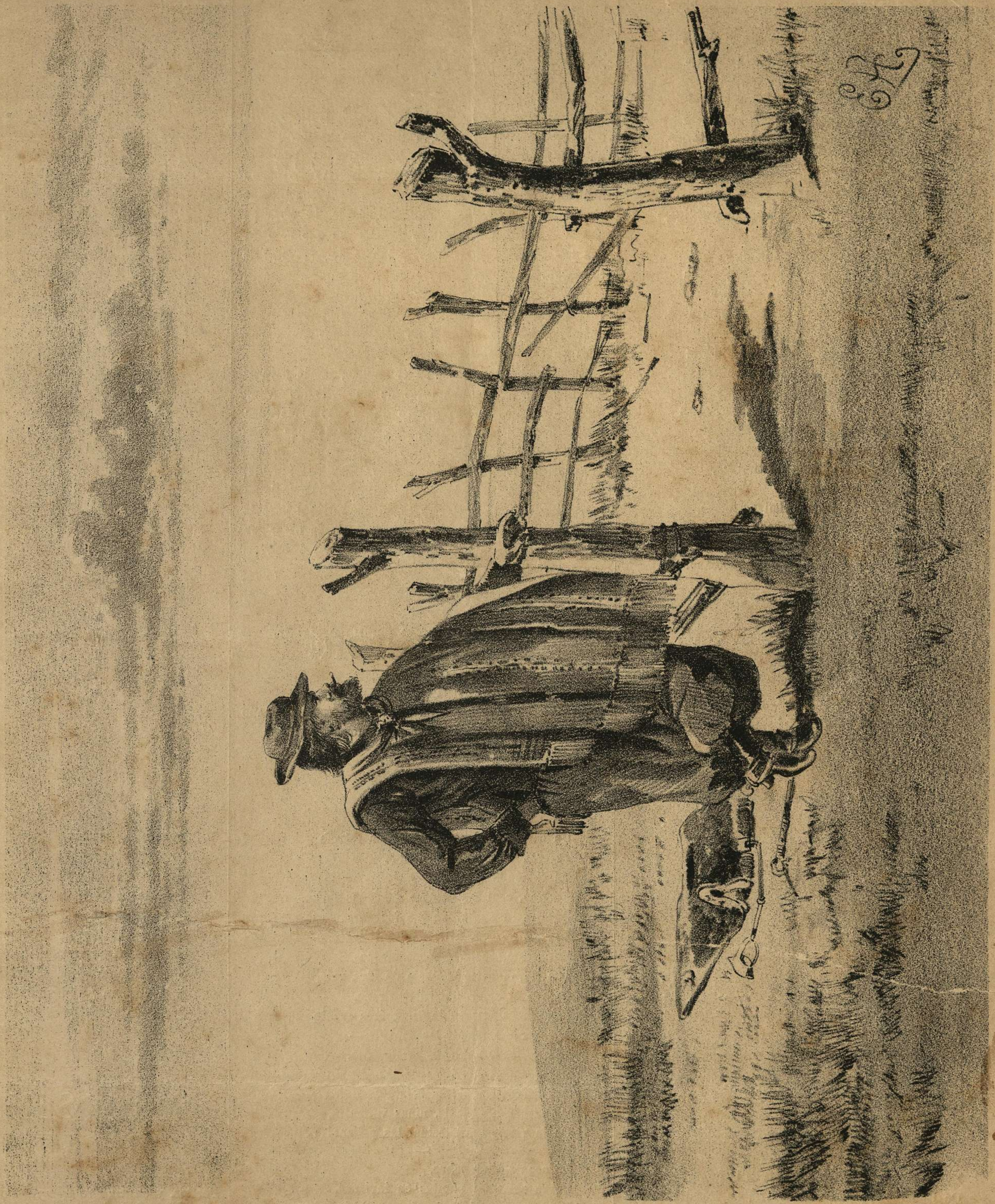
El Gaucho criollo.