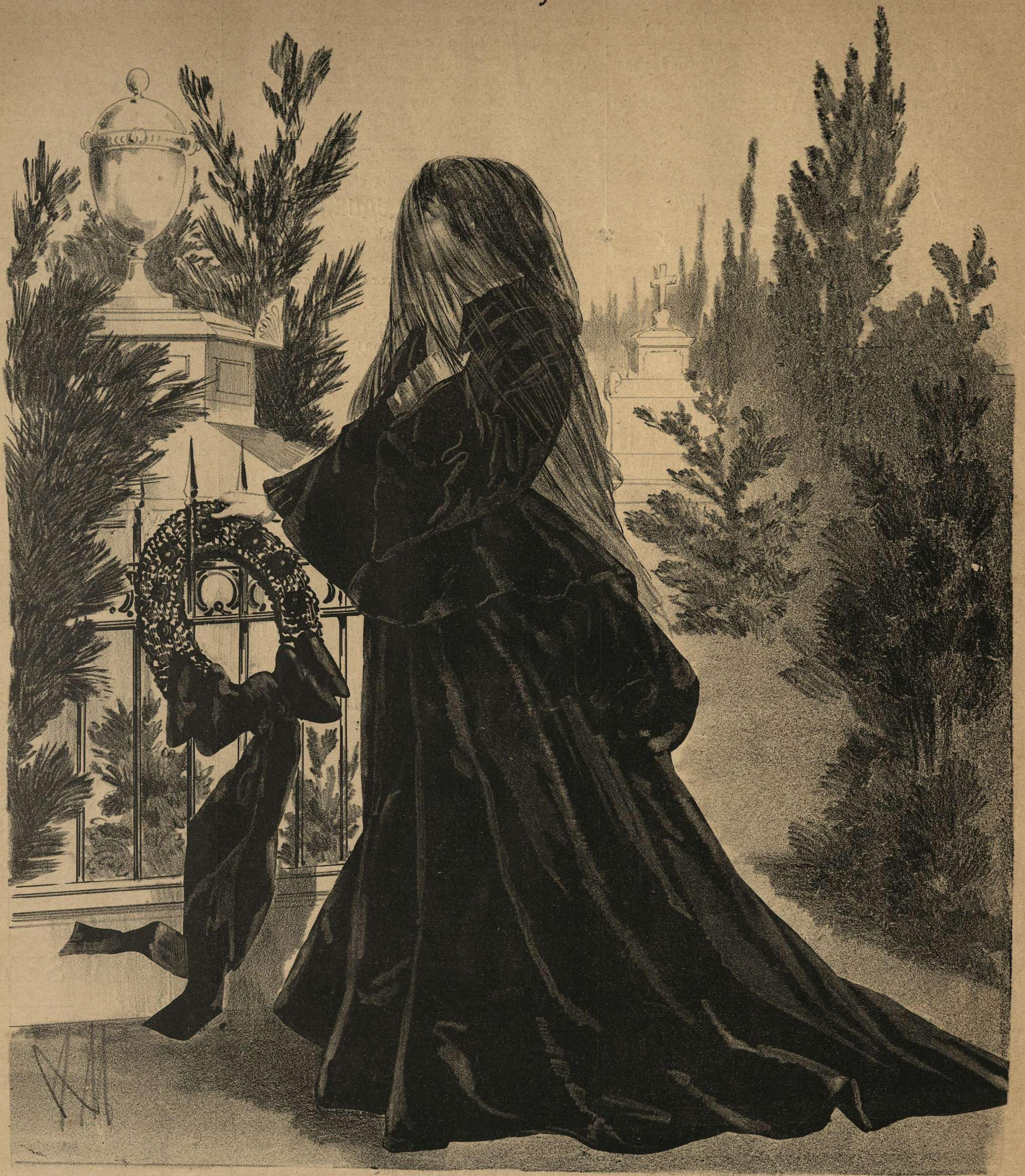
LA TUMBA DEL ESPOSO.