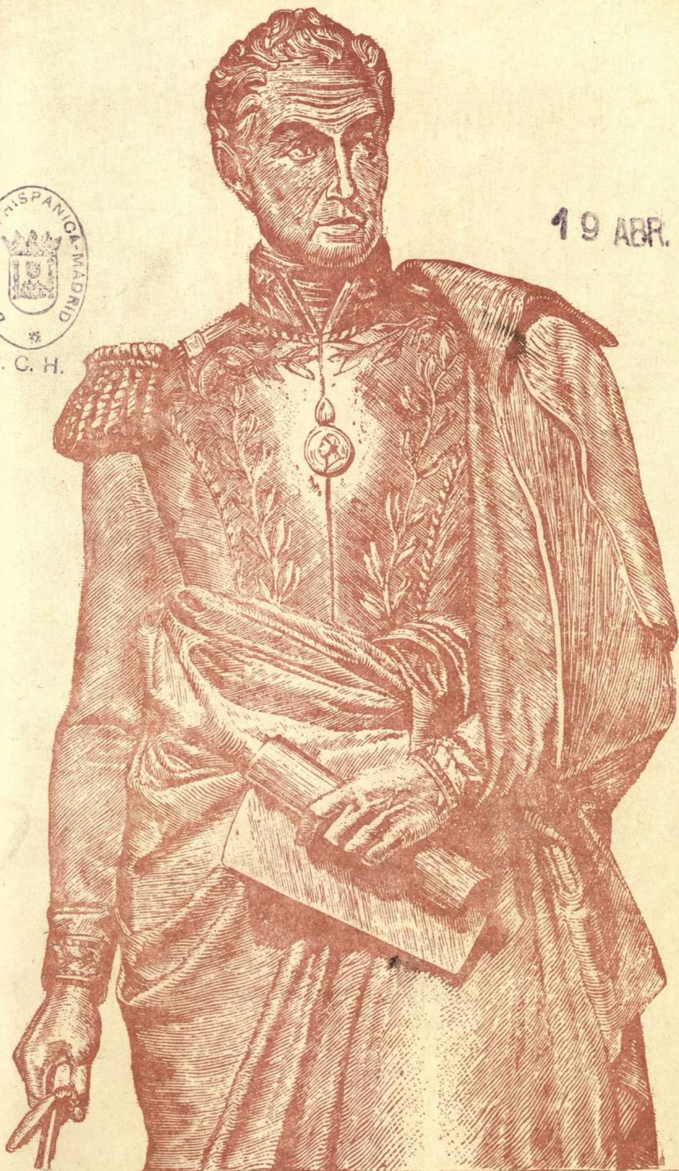
"Bolívar Pedagogo y Periodista", (Página 1052).