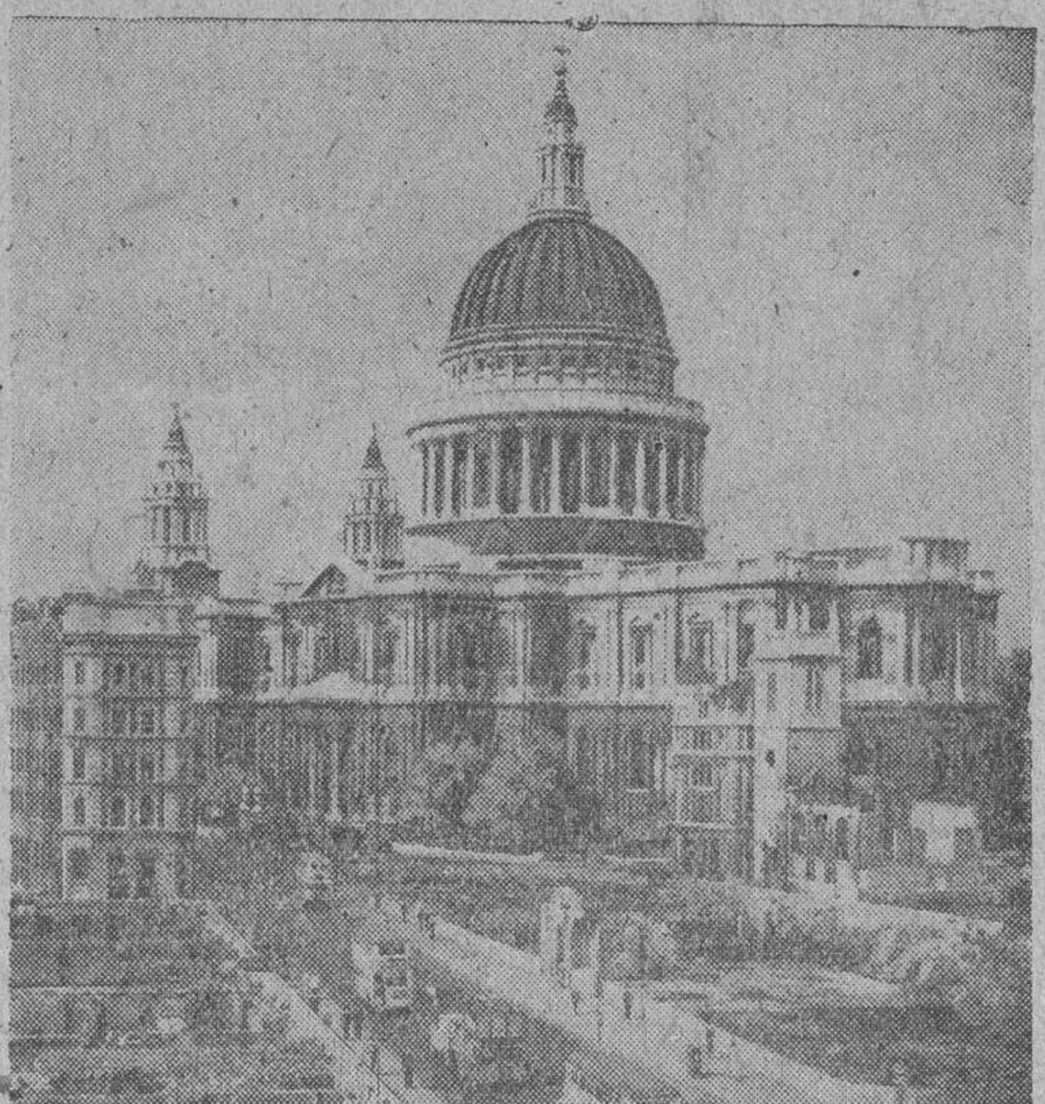
La fotografía recoge el estado actual de la zona londinense en que está enclavada la Catedral de San Pablo, cuyo sector ha quedado libre de solares, convirtiéndolos en bellos jardines