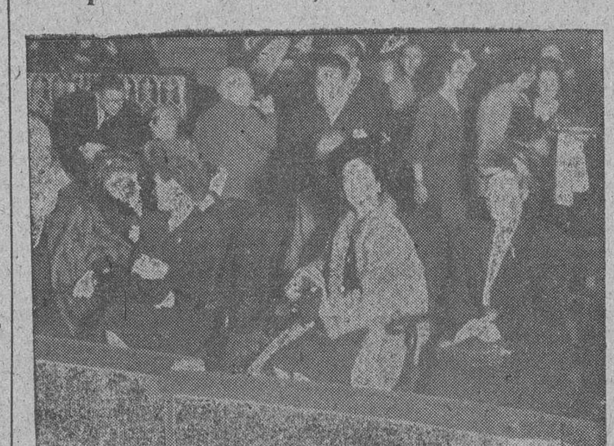
En el Circo de Price se ha celebrado la fiesta anual que organiza Auxilio Social y a la que asistieron más de seis mil niños. La esposa de Su Excelencia el Jefe del Estado dio brillantez al acto con su presencia.