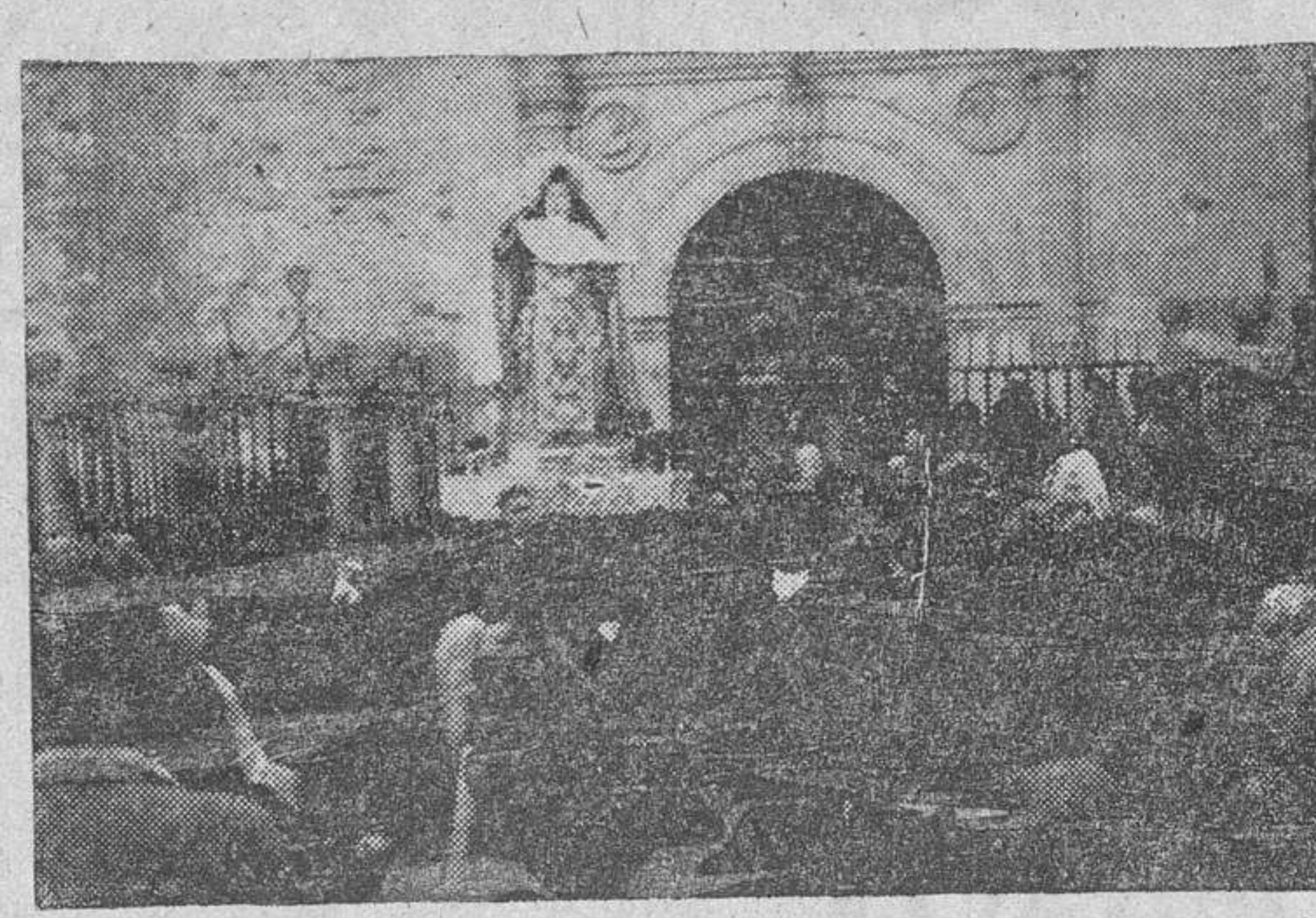
La imagen de Santa Teresa de Jesús al dirigirse a la Basílica en construcción para presidir los actos religiosos durante la inauguración de la capilla de las Hijas de María de la diócesis de Salamanca.