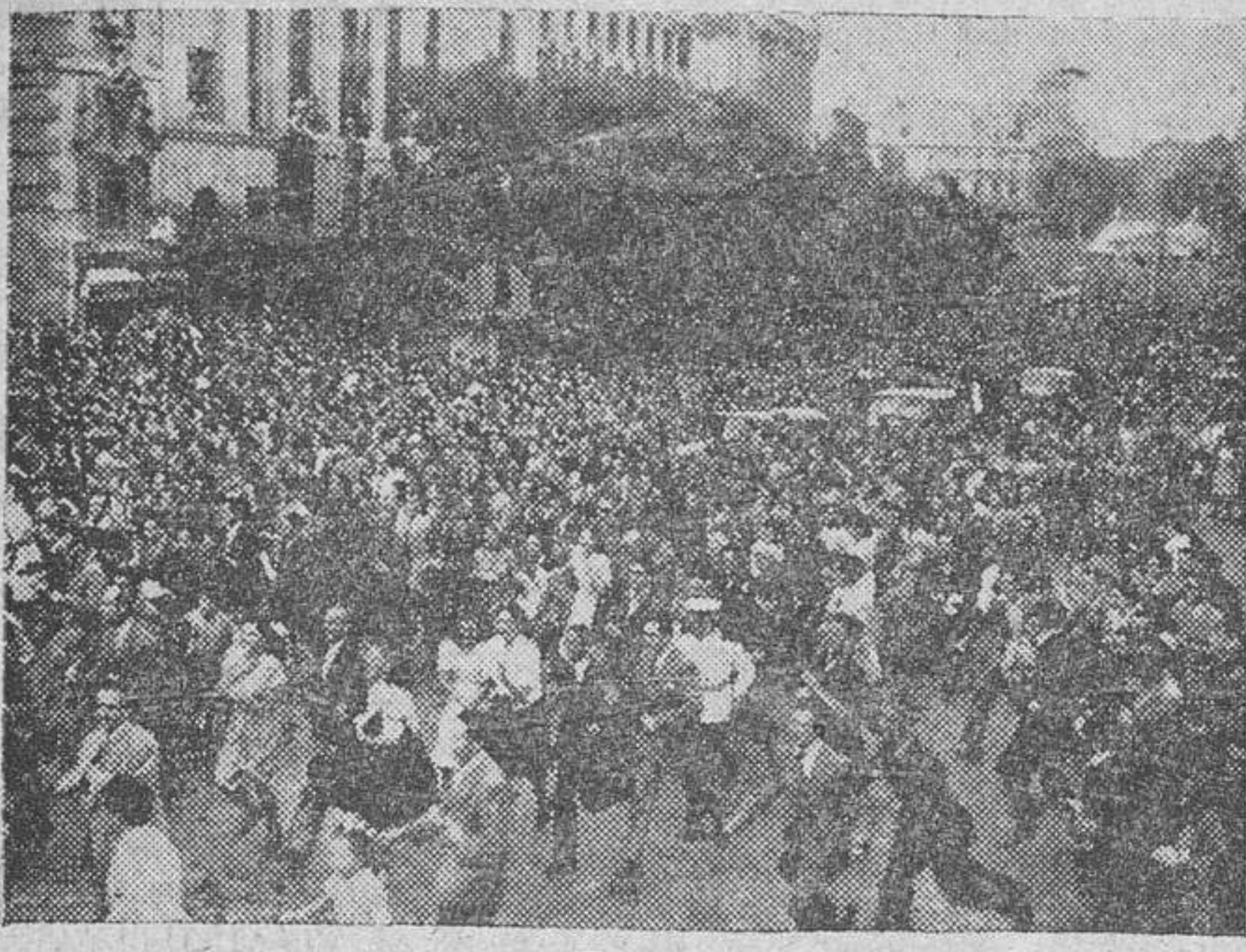
Imponente aspecto que ofrecía la calle de Alcalá, donde se ve a la inmensa multitud que en avalancha sigue corriendo tras el coche del Caudillo, aclamándole. (Foto Vidal).

Tiene un valor excepcional el viaje del Caudillo por el Levante español y el recibimiento que el pueblo madrileño le ha tributado al reintegrarse, en la tarde del lunes, a su residencia. A través de las ciudades visitadas, se ha visto a un pueblo hermanado, enardecido de entusiasmo patriótico. Valencia, Baleares, Cataluña, y, finalmente Madrid, han vivido jornadas inolvidables, y han sabido dar impresionantes muestras de la profunda emoción con tanto y tan entrañables demostraciones del amor auténtico y sin precedentes, que el pueblo español profesa al Caudillo, salvador de España, que en las visitas que realiza demuestra hasta qué punto siente los afanes y las inquietudes de todos los españoles. Lo mismo los pueblos pequeños, a los que también quiere llegar el Jefe del Estado, que las grandes ciudades, rivalizan en el clamor de sus vítores.