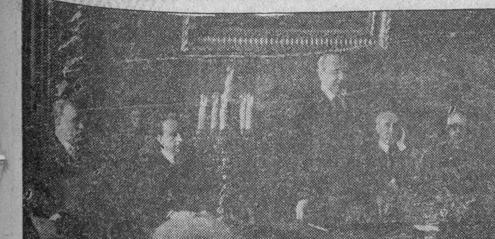
El presidente de las Cortes, don Esteban Bilbao, ha dado posesión del cargo de presidente del Tribunal de Cuentas, a don Eduardo Aunós. Asistieron al acto los ministros de Hacienda y de Justicia.