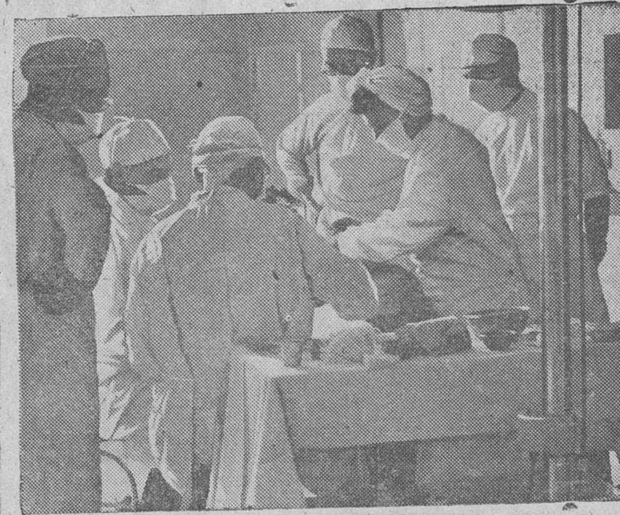
Fotografía tomada en el quirófano del hospital "Raina Victoria", de cirugía plástica, durante una operación.

El día 8 de septiembre deben de estar ya todos los objetos artesanos que vienen al Concurso en la Delegación Sindical de Salamanca