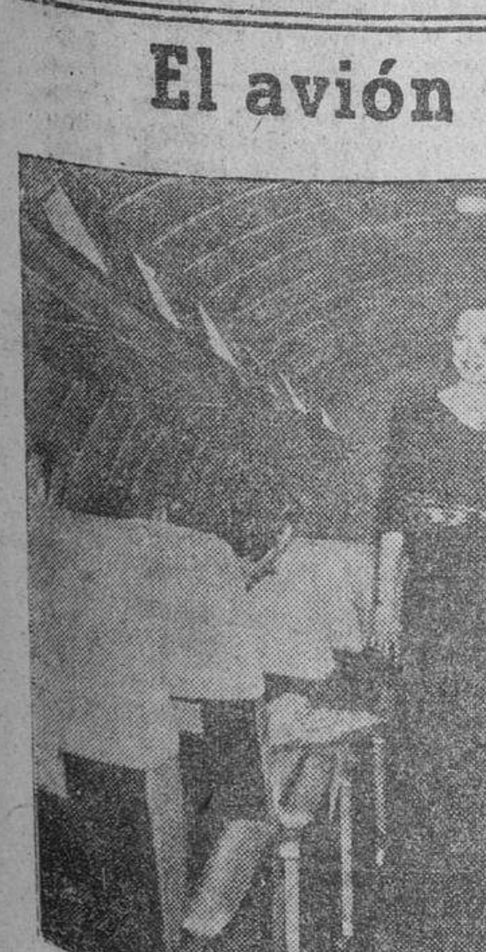
Una casa de modas ha tenido el acuerdo de hacer exhibiciones de sus modelos durante los viajes aéreos Nueva York-Londres. París. La popularidad ha sido muy bien acogida por las damas viajeras. Los respectivos esposos se sentirán muy intranquilos.