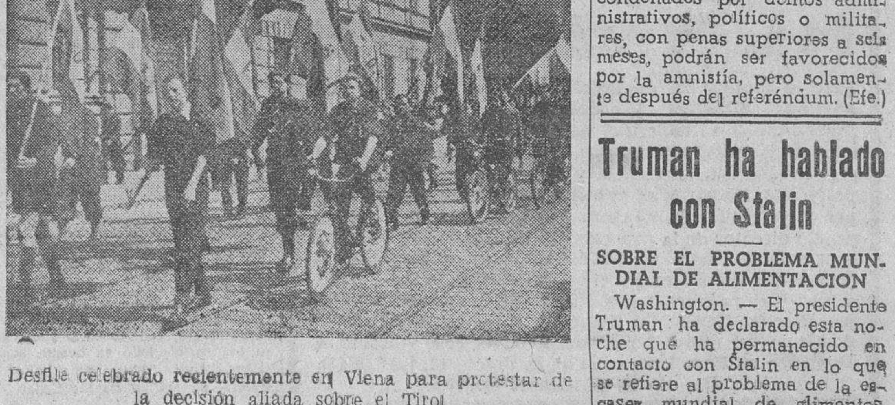
Desfile celebrado recientemente en Viena para protestar de la decisión aliada sobre el Tiro