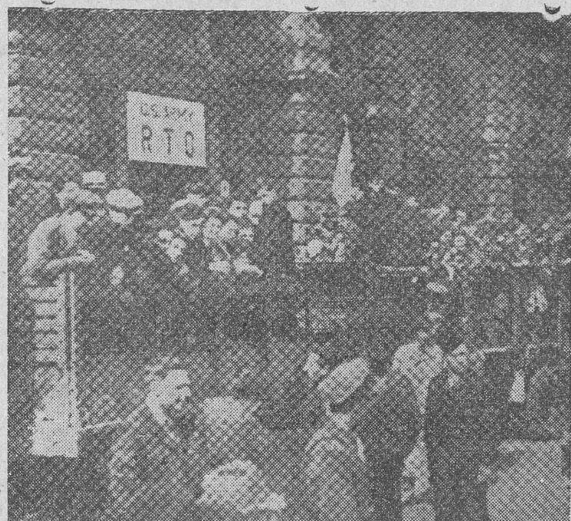
Llegada a Frankfurt de un convoy de judíos desplazados de Alemania, que se dirige a Marsella, para embarcar rumbo a Palestina