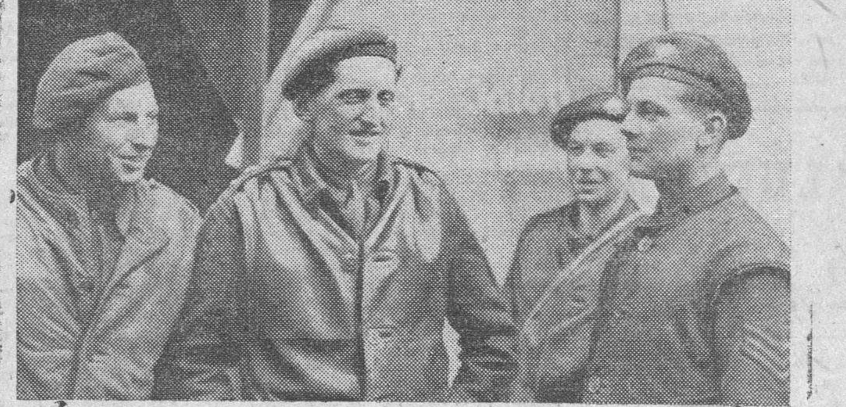
El capitán del Ejército inglés Lidell (centro), que ganó la Cruz Victoria, la más alta condecoración militar, durante uno de los últimos combates de la guerra en Europa