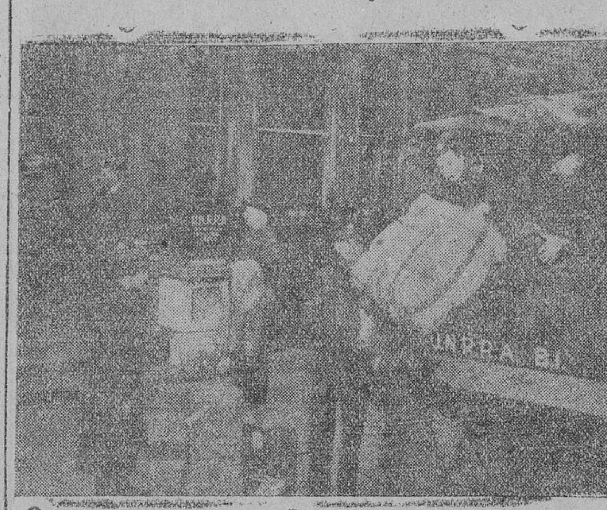
Momento en que los camiones del servicio de la U. N. R. R. A. llegan a la capital de Francia, llevando víveres y abastecimientos para la población civil

SOLEMNE ACTO RELIGIOSO EN LA HERMANDAD MADRILEÑA DE NUESTRA SEÑORA DEL CARMEN LA ESPOSA DEL CAUDILLO Y EL MINISTRO DE MARINA ACTUAN DE PADRINOS EN LA BENDICION DE UNA IMAGEN