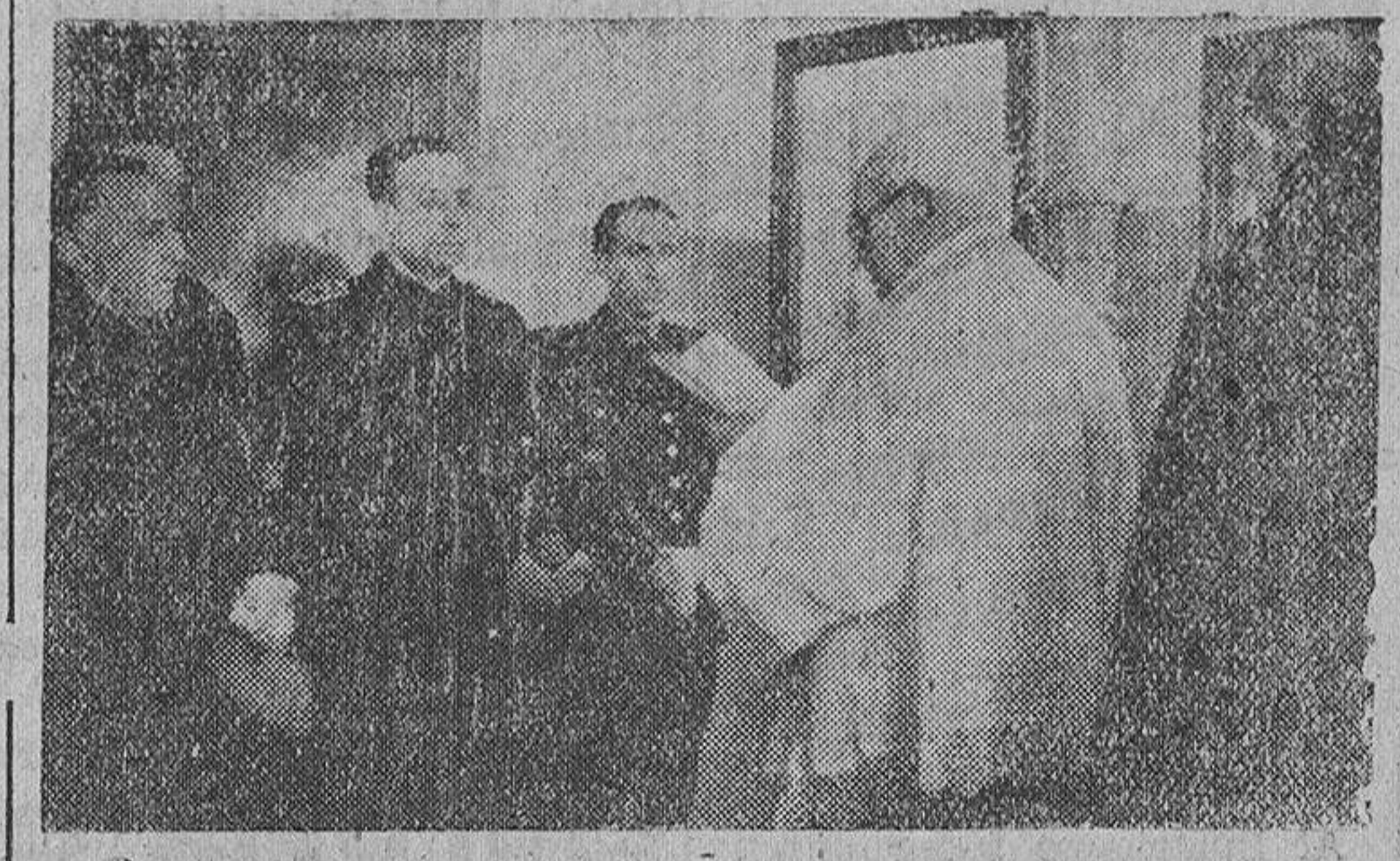
El excelentísimo señor Gobernador civil y jefe provincial del Movimiento, delegado provincial de Auxilio Social y autoridades de la villa, en el momento de la bendición del nuevo centro.

ferencia, atenderá a 500 niños de la comarca en que está enclavado, y su montaje ha sido realizado con todos los adelantos de la puericultura e higiene modernos.