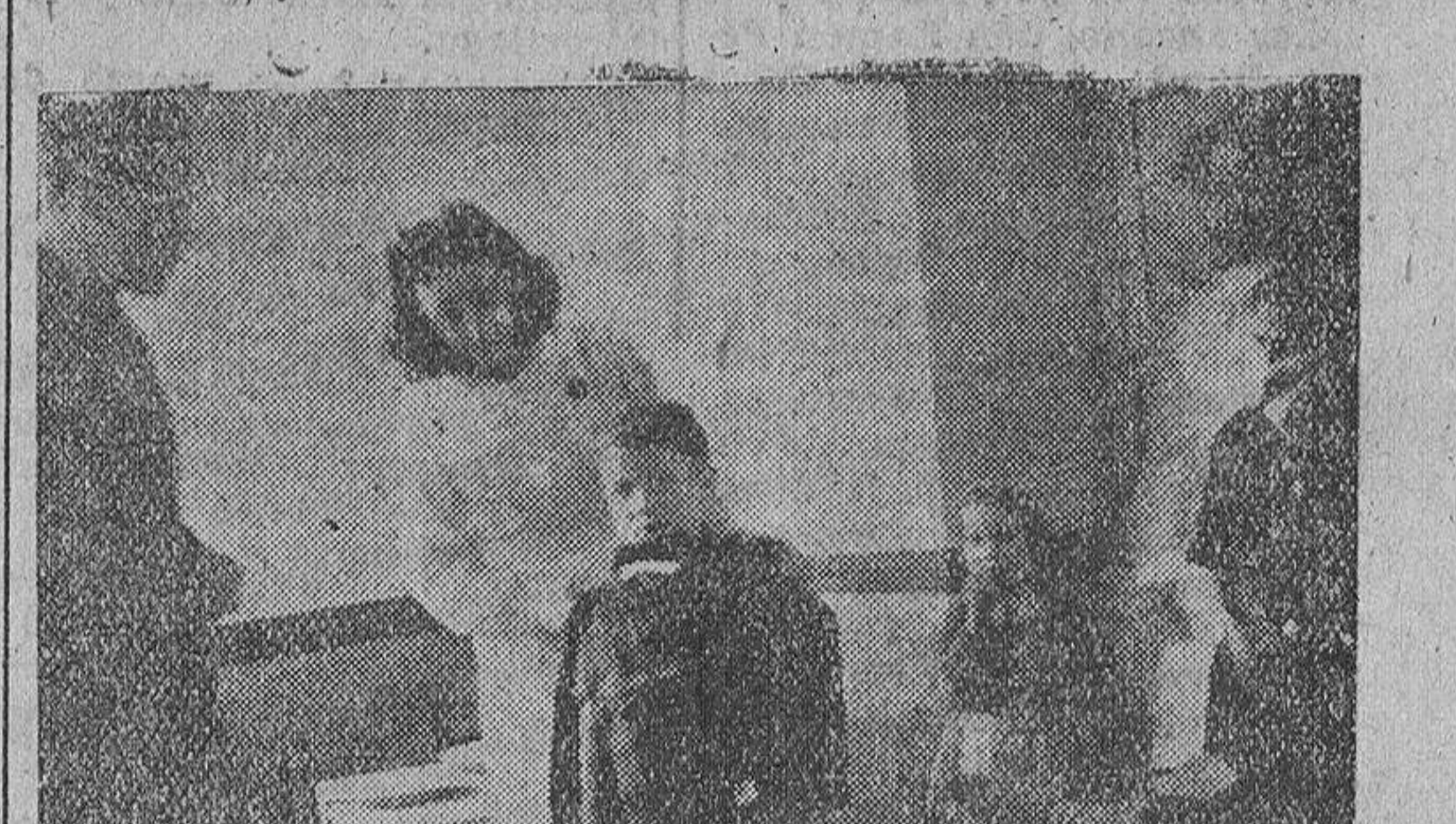
Reparto de ropas a los niños asistidos en el Centro de Alimentación Infantil (Foto Horna).