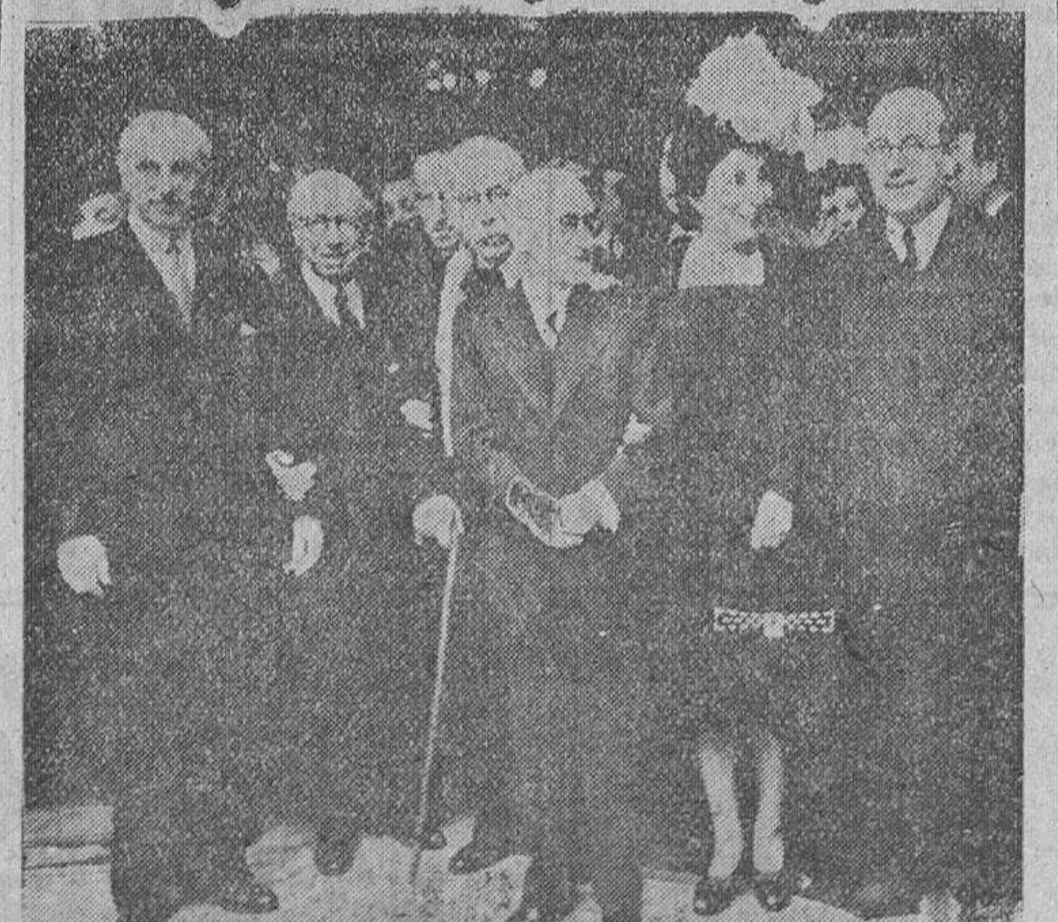
La insigne actriz Lola Membrives, en unión del ministro de Educación Nacional y algunos asistentes al acto de homenaje que se le tributó el domingo, entre los que figuran don Jacinto Benavente, don Mariano Benlliure y don José María Pemán.