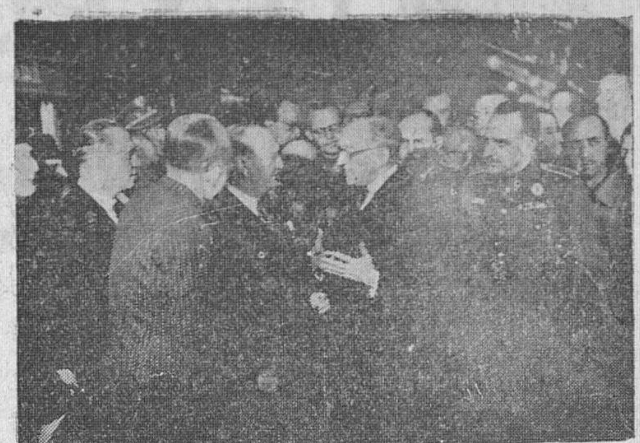
El ministro de Obras Públicas, señor Peña, el alcalde de Madrid, señor Alcocer, autoridades y jerarquías, en una de las estaciones del "Metro" de la línea denominada de los Bulevares, que fué inaugurada el jueves.