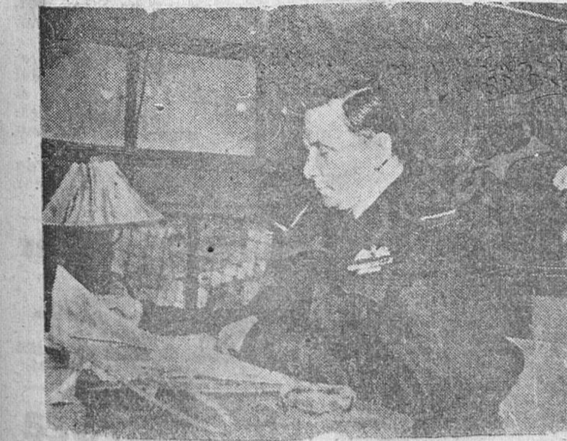
Sir Arthur Tedder, comandante en jefe de las fuerzas aliadas en el Mediterráneo, que ha sido designado para mandar el Ejército de invasión, a las órdenes del general Eisenhower