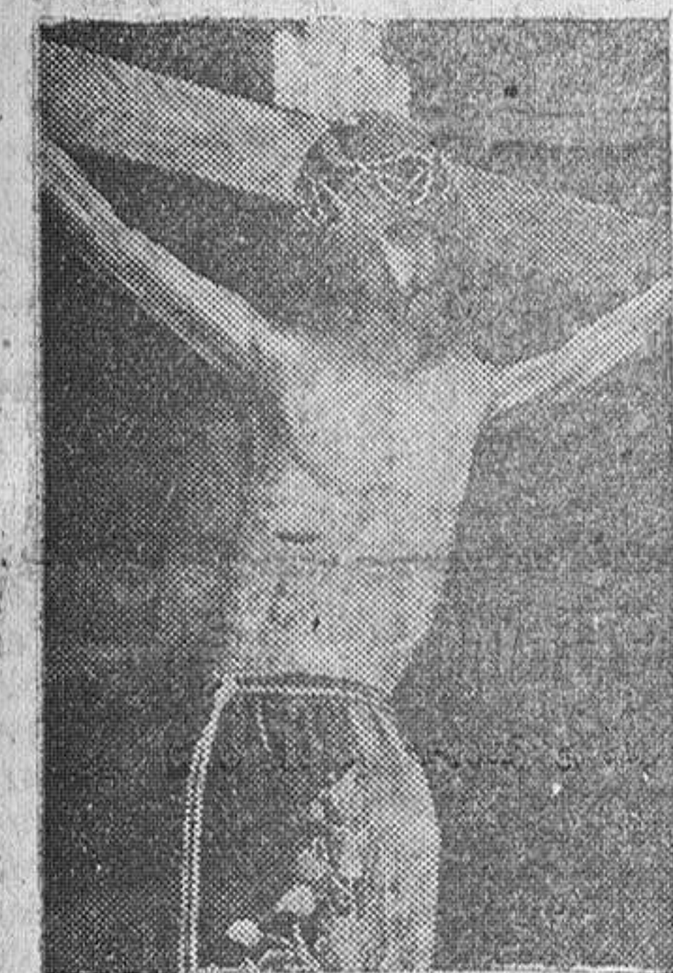
La procesión del Santísimo Cristo de los Milagros saldrá en el día de hoy, seguida, como siempre, por los fieles y devotos, que rogan porque con el agua desaparezca la intranquilidad del labrador y del ganadero y hasta la de todos los que del trabajo y de la actividad industrial viven.

Están secos los campos, una perturbación amenaza con producir graves daños para la ganadería y la agricultura salmadrinista. Por eso se vuelven los ojos al cielo en súplica del beneficio de la lluvia que traiga la promesa de un mañana espléndido.