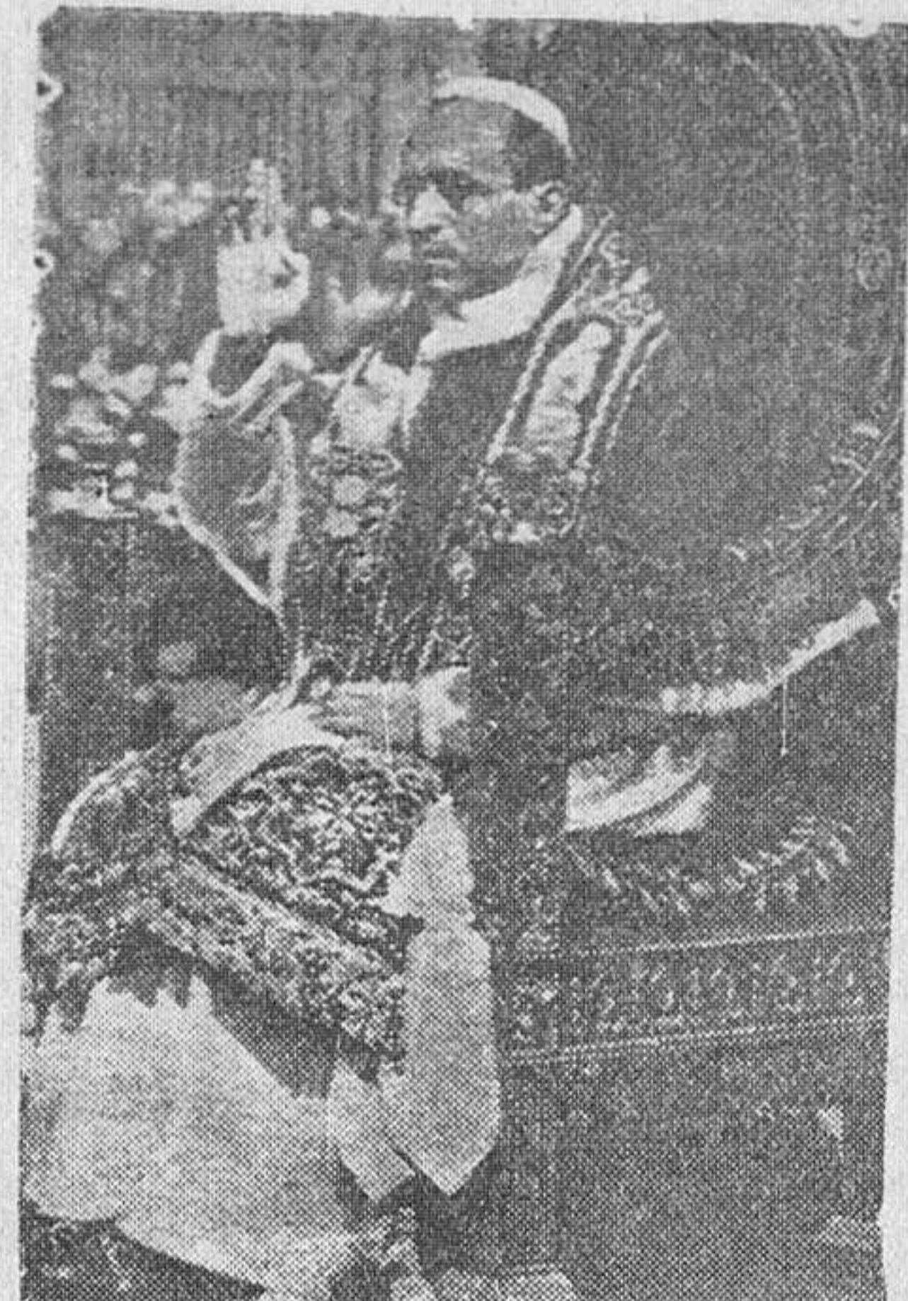
... porque ni los que sufren o lloran, pueden remediar su presente dolor...