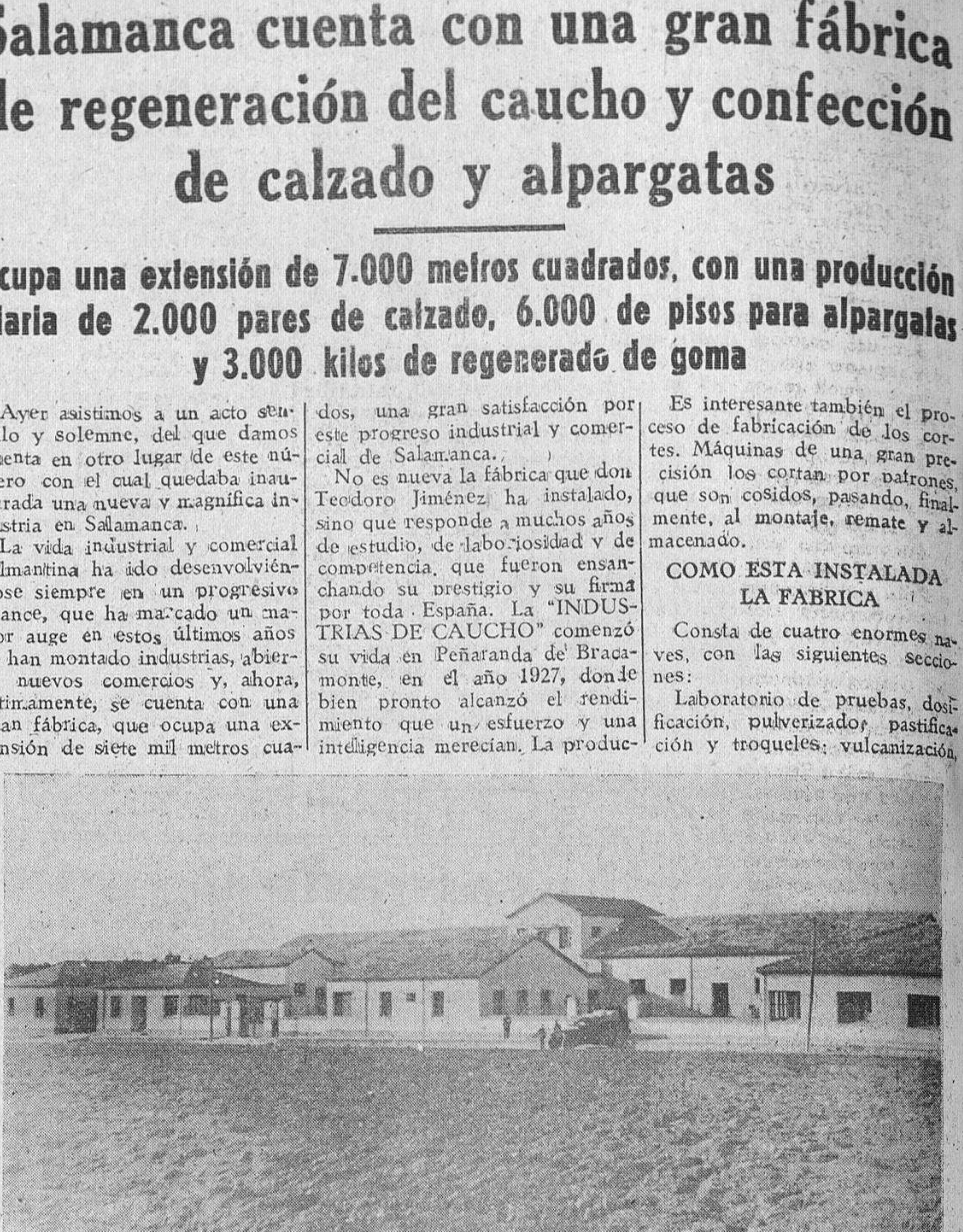
Una vista general de la fábrica

drados y que viene a traer un nuevo prestigio para la ciudad.