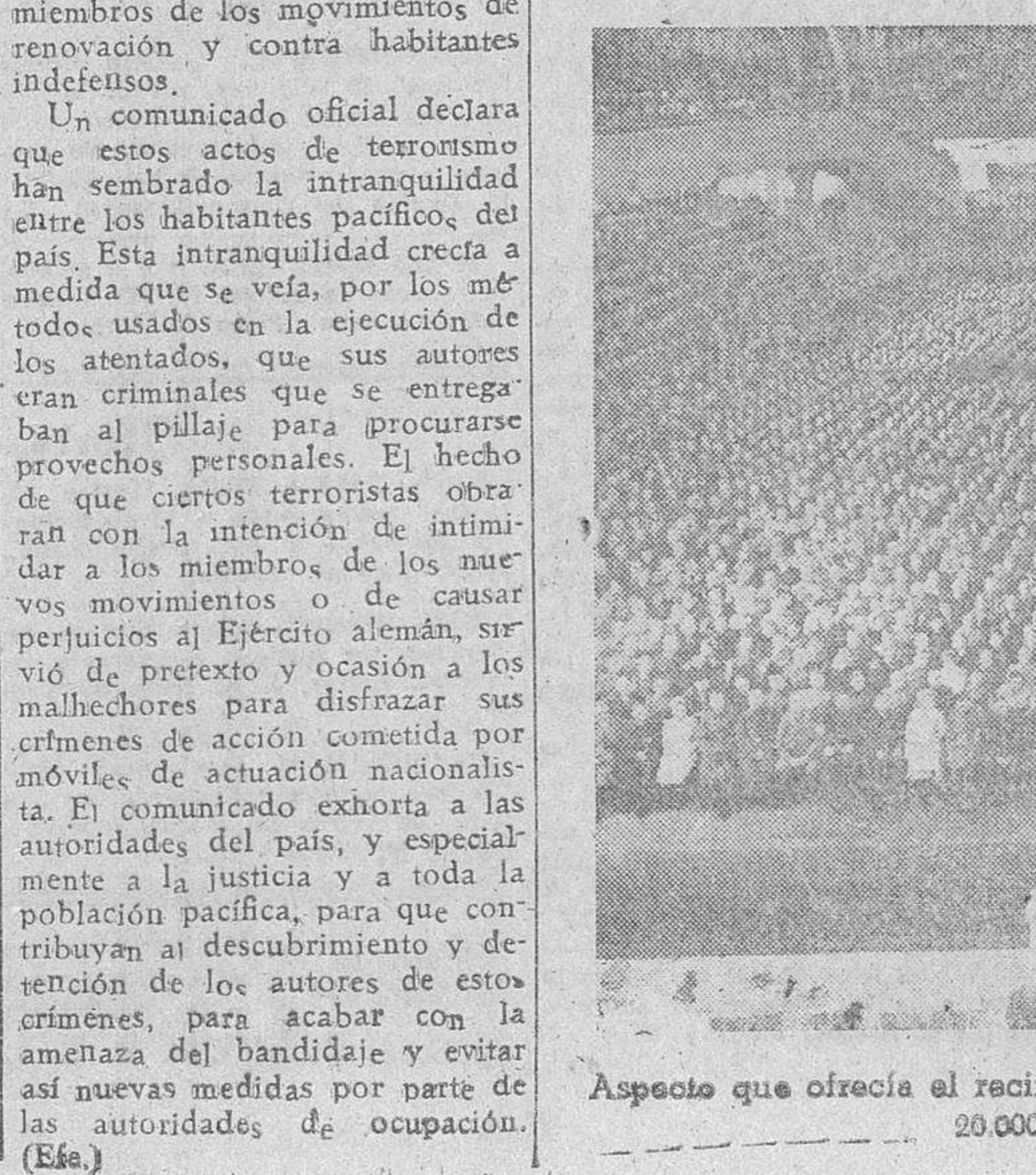
Aspecto que ofrecía el recinto, en el cual el canciller alemán pronunció un discurso ante 20.000 nuevos oficiales del Ejército del Reich.