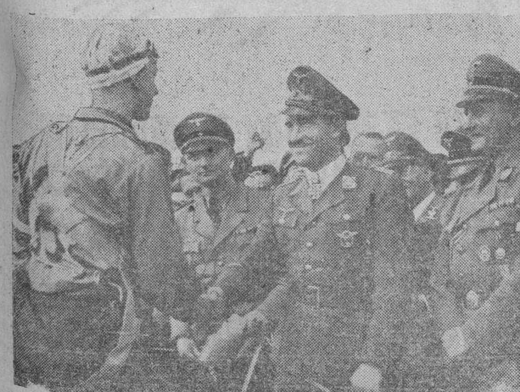
Ultimamente ha tenido lugar en Alemania un campeonato de aviación entre los muchachos de las Juventudes Hitlerianas. A él asistieron como huéspedes de honor altas personalidades del Ejército alemán. En la foto, el general de la Aviación, Meiland, felicita a uno de los vencedores.