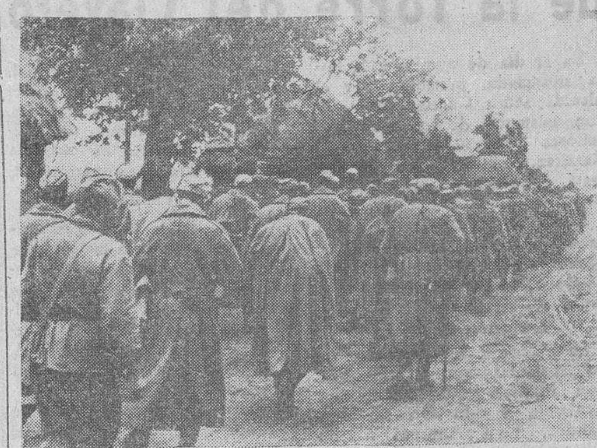
Columna de prisioneros, rusos, en marcha hacia los campamentos de concentración.

Comunicado aliado Cuartel General aliado en el Pacífico suroeste: El comunicado anuncia la prosecución de los ataques aéreos aliados contra las vías de comunicación terrestres y marítimas y los aeródromos japoneses a través del Pacífico suroeste. Respecto a su conversación de tres horas con el embajador alemán, Von Papen, afirmó que había tenido carácter privado. Anteriormente, en una declaración a un representante del diario turco "Tasvir Efkier", Guariglia dijo: "Soy un viejo y sincero amigo de Turquía y al marcharme me llevo una impresión imborrable de mi estancia en este país, sintiendo que ésta se halla limitada a cuatro meses." Guariglia puso de relieve que Turquía e Italia son dos países mediterráneos, cuyas "buenas relaciones son obra de la naturaleza". Toda política basada en pasiones humanas—añadió—no da en general, buenos resultados, mientras que si está basada en la inteligencia suele darlos mejores. Regreso a Italia en un momento crítico y me es imposible, por consiguiente, hacer declaraciones de carácter político. Lo único que sí puedo decir es que mi gestión se inspirará únicamente en la realidad de los hombres.—(Efe.) Militarización de servicios Londres.—La radio italiana anuncia que el Gobierno Badoglio ha militarizado los servicios de ferrocarriles, Correos y Telégrafos y Radiodifusión.—(Efe.)