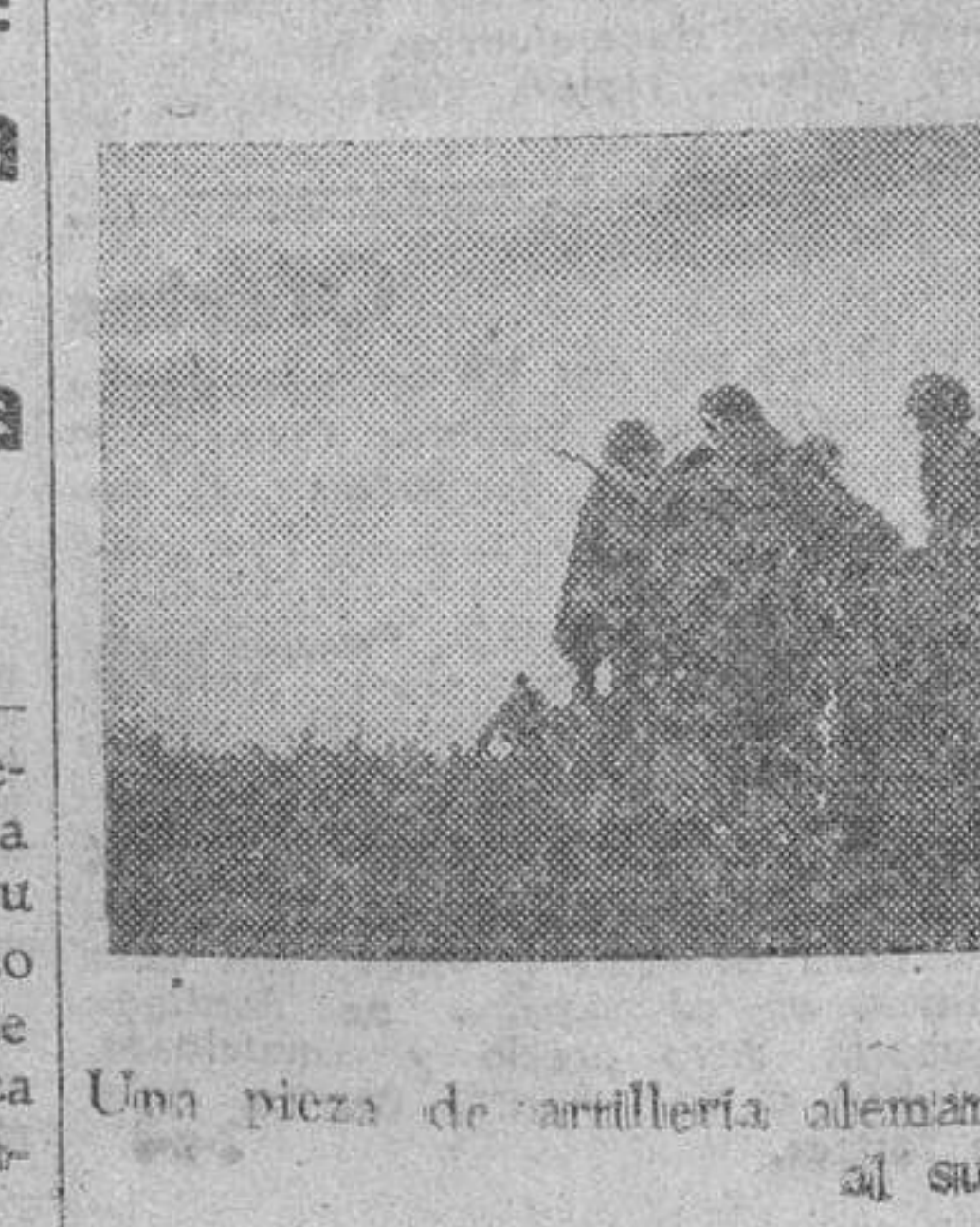
Una pieza de artillería alemana avanza seguida de la infantería, al sur de Orel.