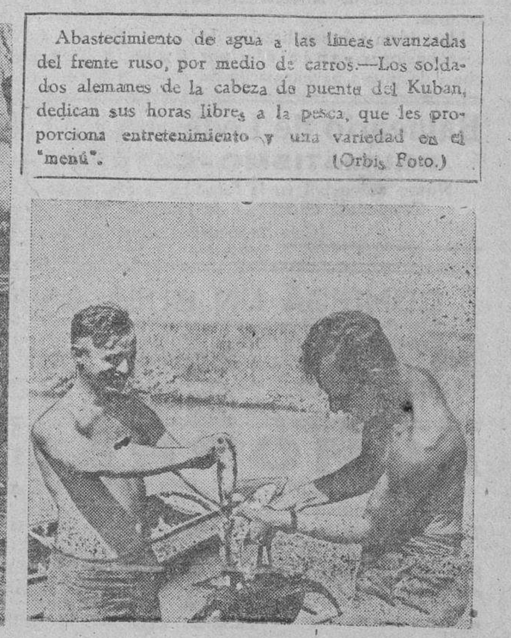
Abastecimiento de agua a las líneas avanzadas del frente ruso, por medio de carros.—Los soldados alemanes de la cabeza de puente del Kuban, dedican sus horas libres a la pesca, que les proporciona entretenimiento y una variedad en el "menú".