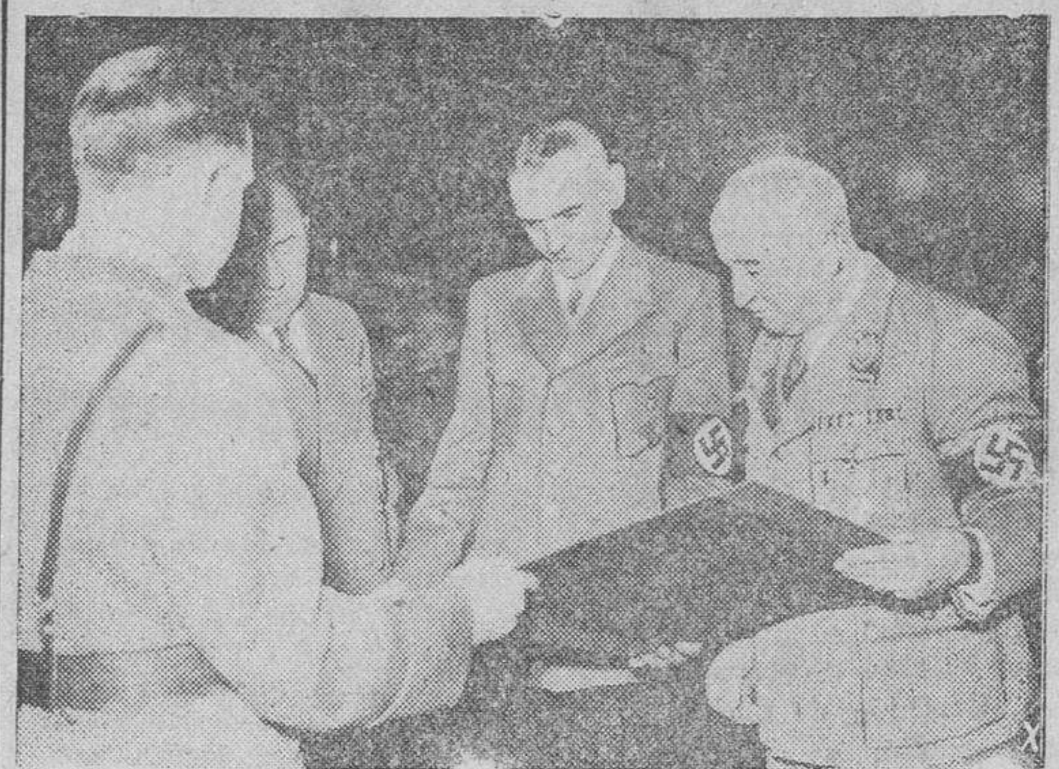
En la nueva Cancillería del Reich, ha tenido lugar recientemente un acto con motivo del quince aniversario de la fundación de la Cámara de Trabajo del Reich. El doctor Ley pronunció un brillante discurso. En la fotografía vemos al doctor Ley condecorado a un industrial.