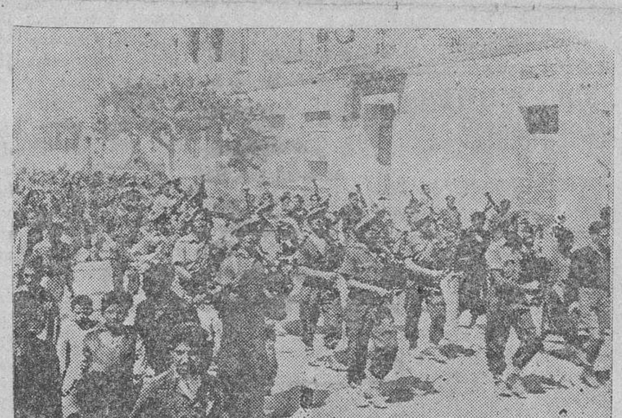
Regimiento escocés, con su banda de gaitas y tambores, desfila por la ciudad de Túnez, después de la ocupación.

Pérdidas del Eje en Africa Londres.—Las fuerzas del Eje han perdido en el teatro de la guerra de Africa los siguientes grupos armados, según informaciones oficiales: Alemania: Quinto ejército blindado "Afrika"; las divisiones blindadas décima, quince y veintuna y "Hermann Goring", además de dieciocho regimientos de granaderos, cuatro regimientos de cazadores y tres regimientos y tres batallones de tanques, así como once regimientos de Artillería. Italia: Primero, quinto y décimo ejércitos, seis Cuerpos de