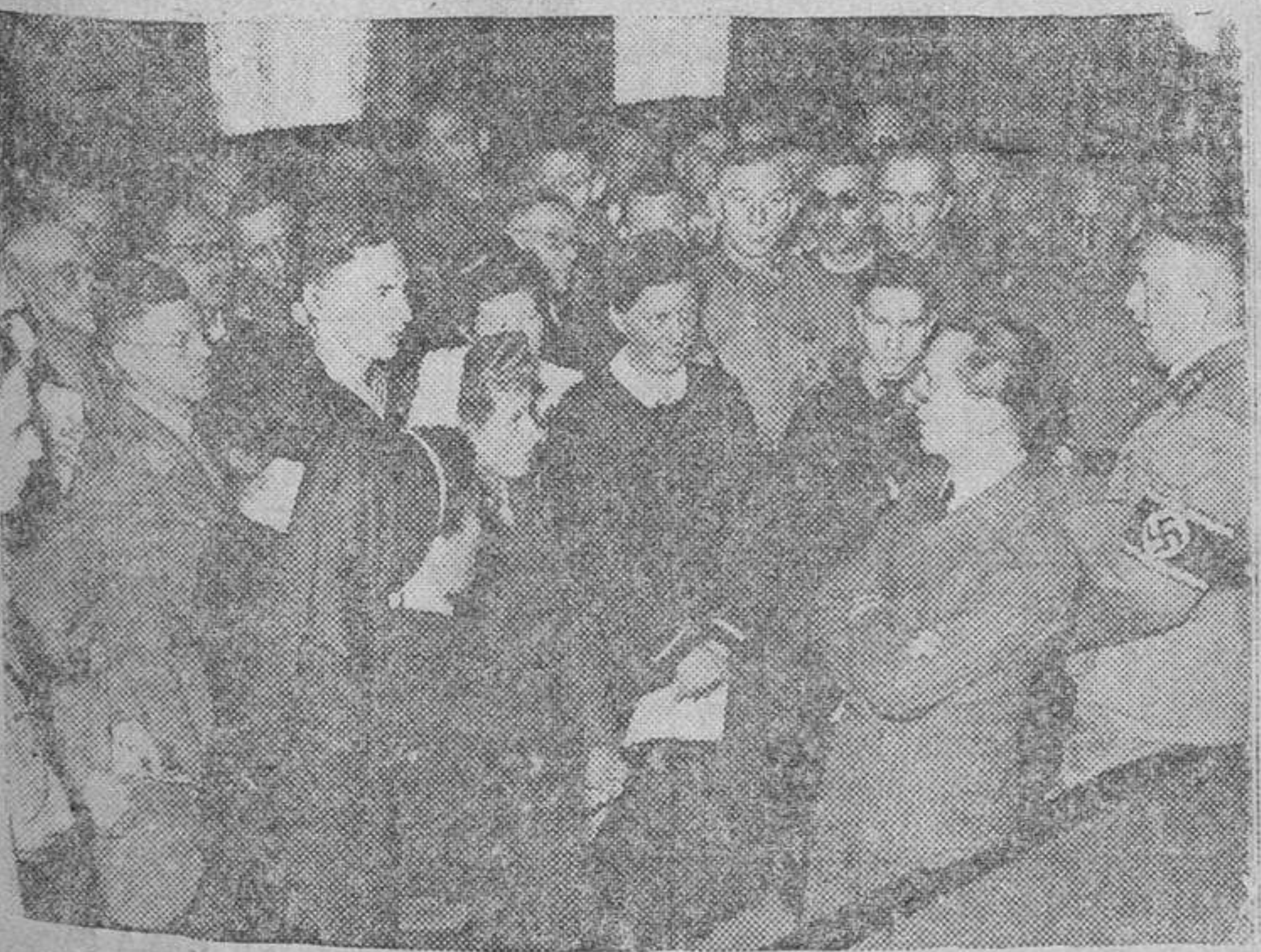
El ministro de Propaganda del Reich, doctor Goebbels, ha condecorado recientemente a numerosos ciudadanos berlineses, así como a miembros de la Cruz Roja, Ejército, Partido y Juventud Hitleriana, por su heroico comportamiento durante los últimos bombardeos angloamericanos sobre la capital del Reich.