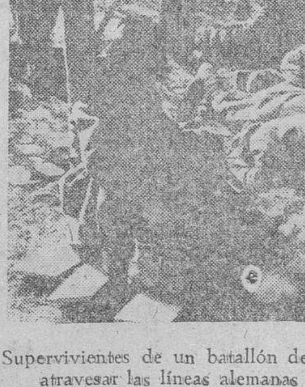
Supervivientes de un batallón de choque soviético que al intentar atravesar las líneas alemanas fué copado por los alemanes.

La lucha entre el ser y el no ser; esto es lo que significa la gigantesca batalla que se libra entre la civilización y el comunismo que empuja y que trata de imponerse en su mundo entero; pero que no logrará sus propósitos. Nuestra guerra de liberación fue el primer paso para destruir al enemigo común. Nuestra juventud heroica, encuadrada en el Ejército y en la Falange, a cuyo frente marchaba Franco, Caudillo y Jefe Nacional, le infligió la primera derrota. Luchamos y vencimos frente al horror del bolchevismo y en defensa de la civilización.