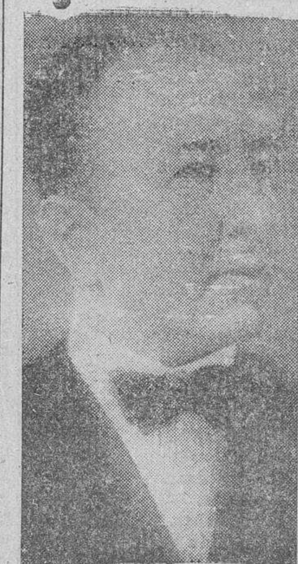
El nuevo embajador alemán

director general de Seguridad, rector de la Universidad Central, presidente de la Diputación provincial, alcalde, una representación del Consejo Nacional y el