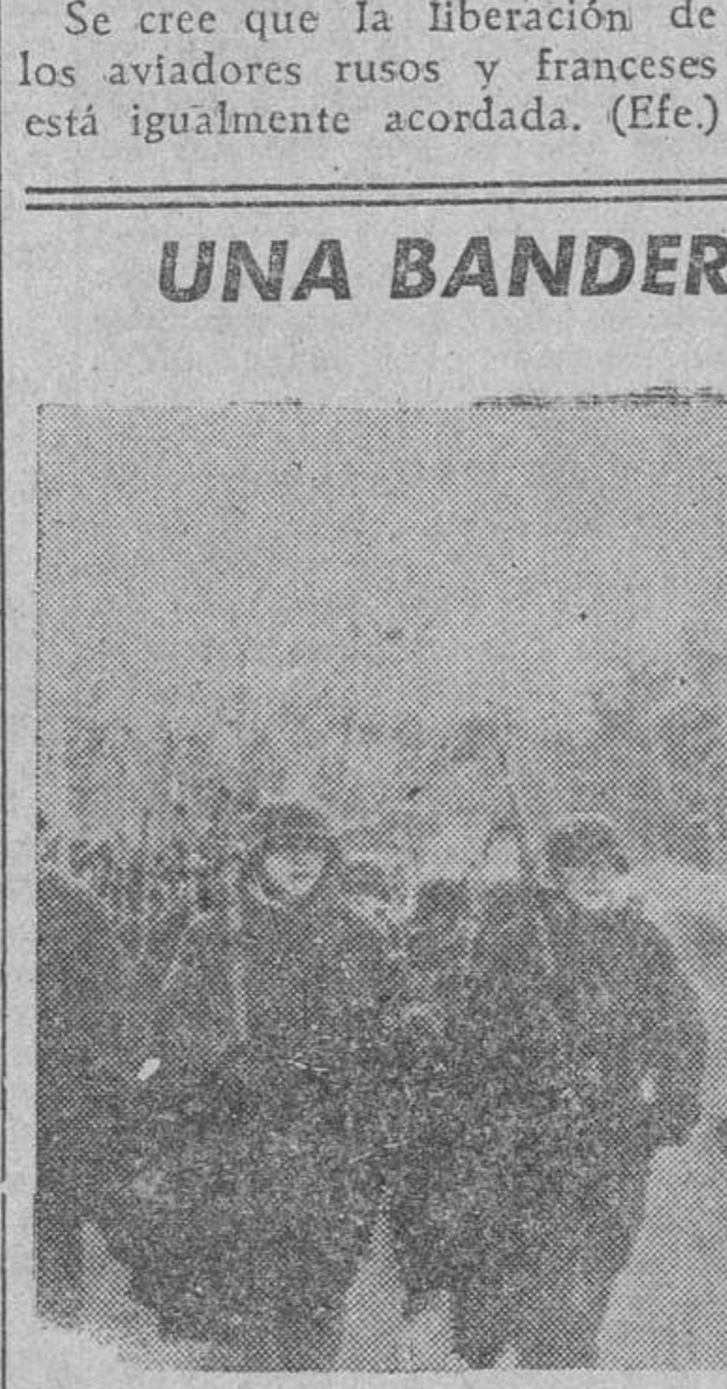
Los voluntarios de un batallón de la División Azul, desfilan por vez primera con la Bandera que le ha sido entregada por el general Infantes, como distinción por su comportamiento en el frente de Rusia