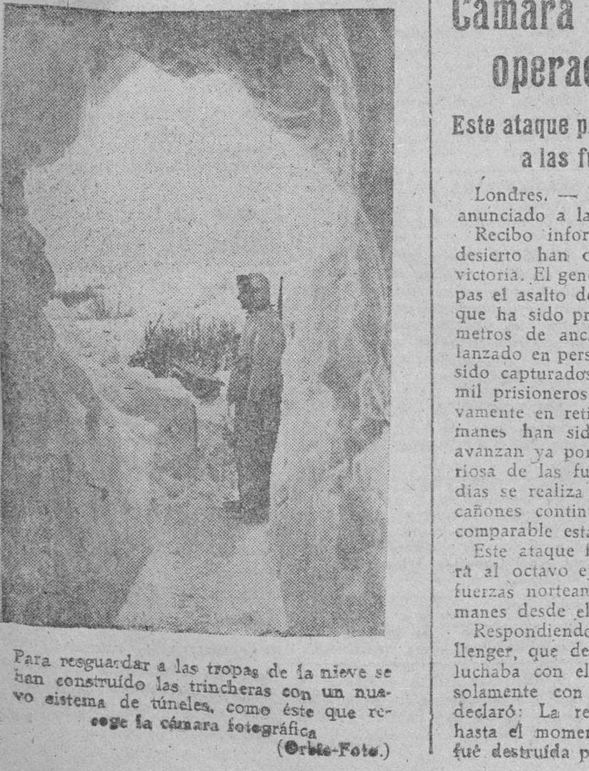
Para resguardar a las tropas de la nieve se han construido las trincheras con un nuevo sistema de túneles, como éste que vege la cámara fotográfica.