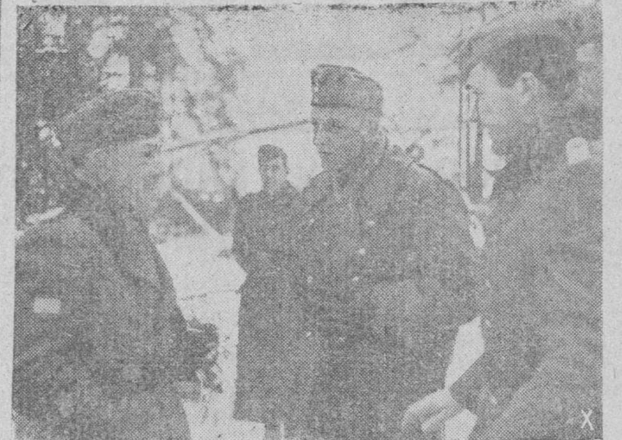
El coronel general Lindemann, comandante en jefe de un ejército alemán, en conversación con el comandante de la División española de voluntarios

LA PRIMERA MEDALLA DE ORO DE LA CIUDAD DE SEVILLA, AL CAUDILLO SEVILLA. — EL AYUNTAMIENTO HA ACORDADO, EN SU SESION DE ESTA NOCHE, CONCEDER LA PRIMERA MEDALLA DE ORO DE LA CIUDAD DE SEVILLA AL CAUDILLO. LA ENTREGA SOLEMNE DE LA MEDALLA SE LLEVARA A EFECTO EN LA PRIMERA OPORTUNIDAD. (LOGOS.)