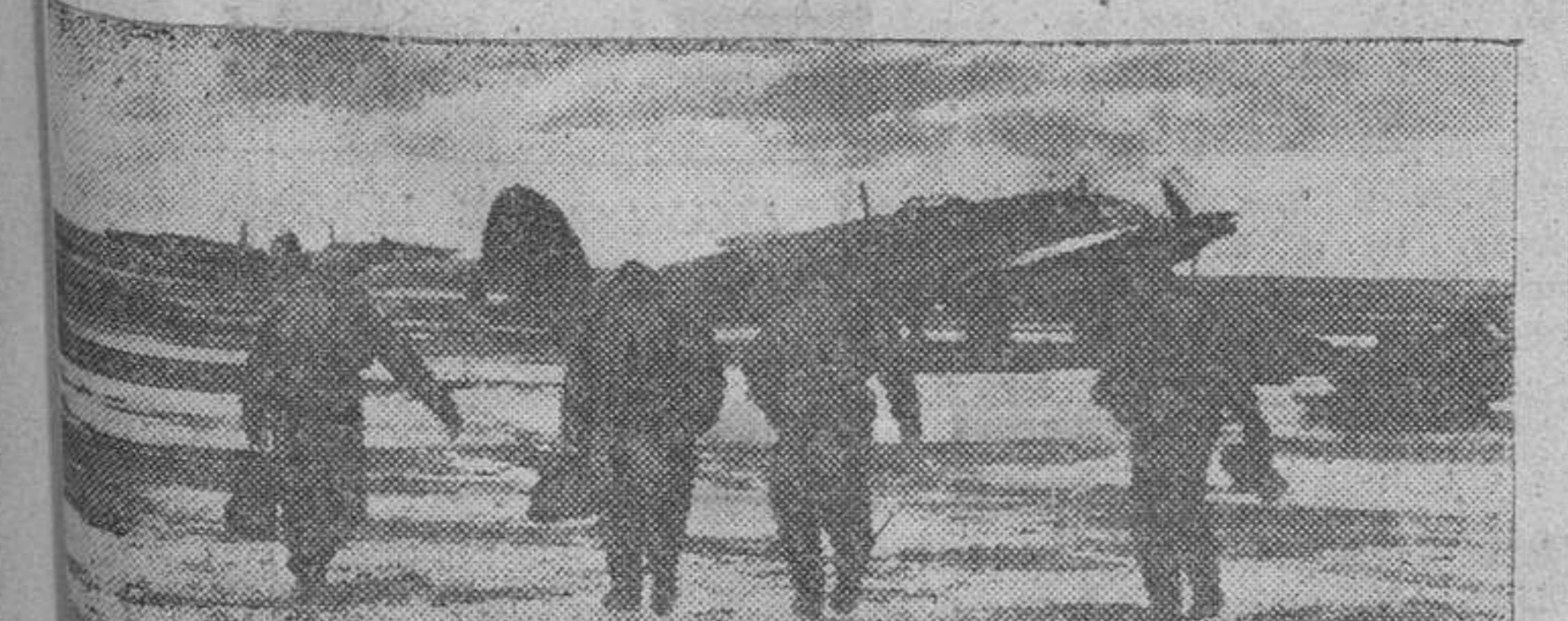
Se sonó la alarma en un aeródromo alemán del frente del Este inmediatamente los pilotos se dirigen a los aparatos para salir al encuentro del enemigo.