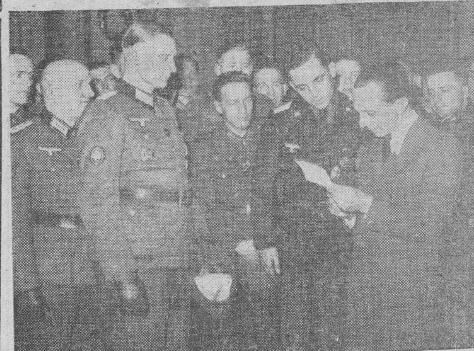
El ministro, doctor Goebbels, recibe a una delegación de combatientes de Veliki Luki, que actualmente visita la capital del Reich. El ministro examina el documento soviético, por el cual se invitaba a la capitulación, que fue rehusada por los defensores.