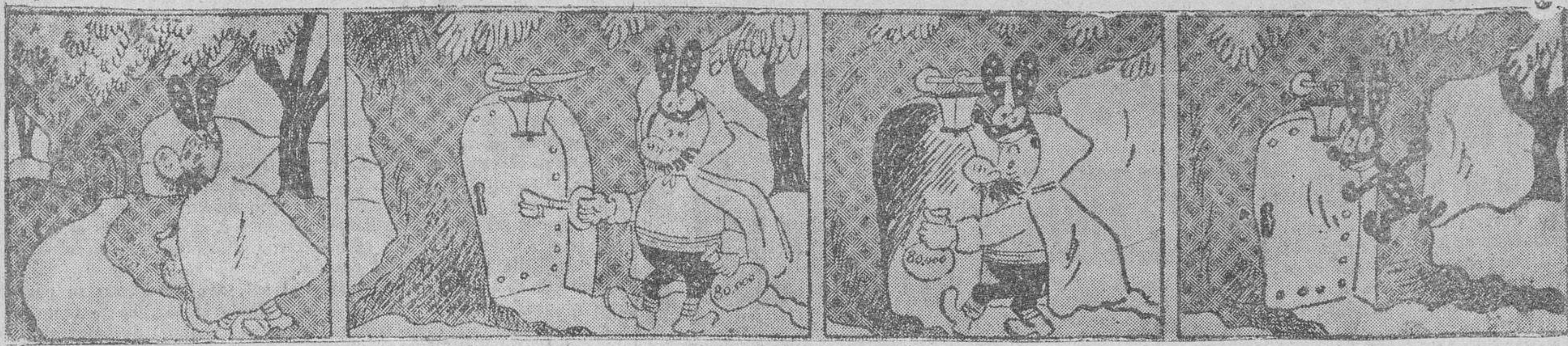
—¿Qué ganas tengo de llegar a mi guarida para acostarme. —(¿Dónde irá este bandido?)