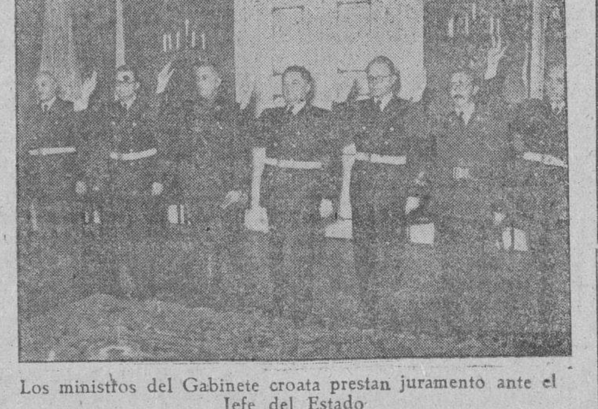
Los ministros del Gabinete croata prestan juramento ante el Jefe del Estado