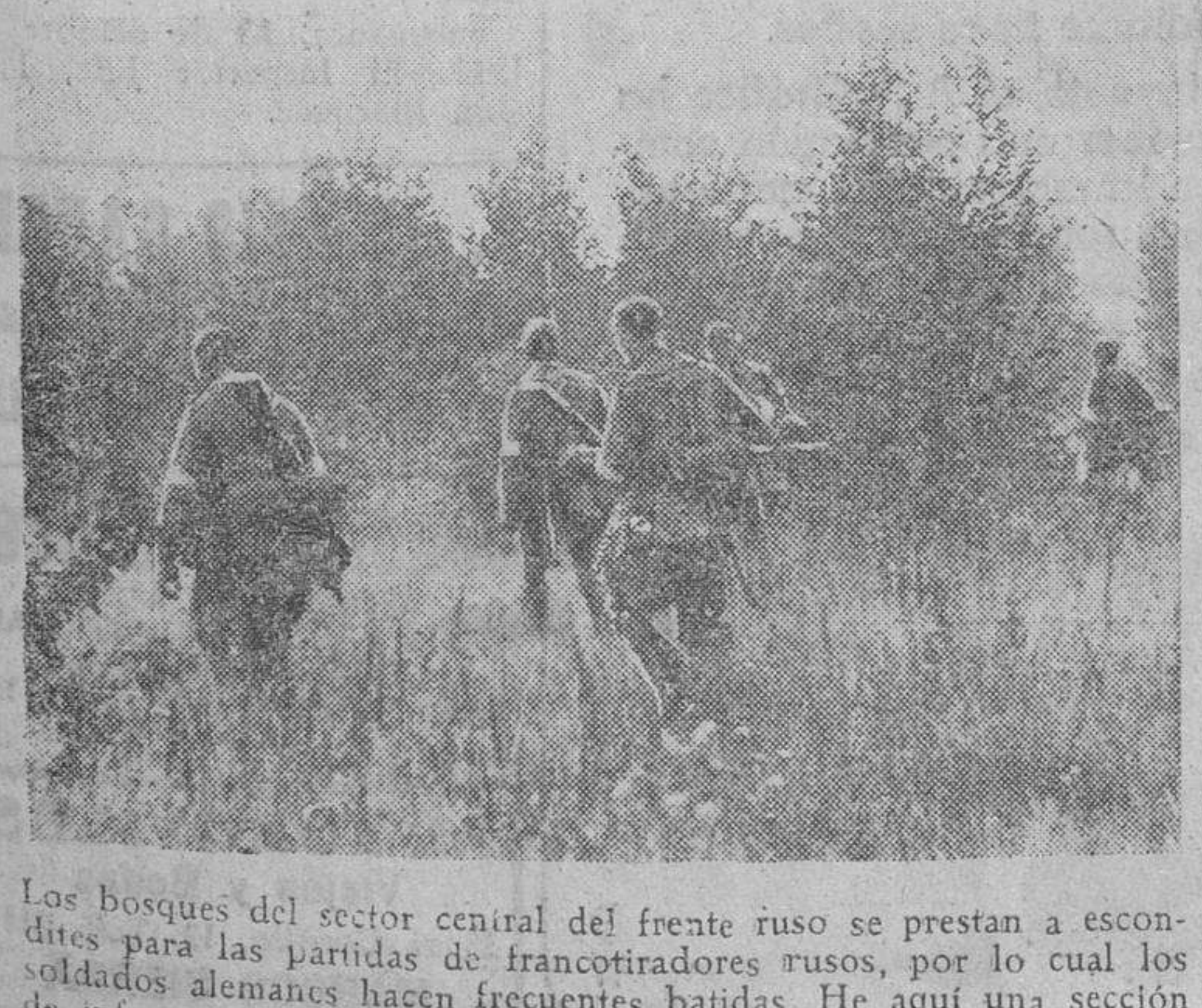
Los bosques del sector central del frente ruso se prestan a escondites para las partidas de francotiradores rusos, por lo cual los soldados alemanes hacen frecuentes batidas. He aquí una sección de infantería adelantándose en un bosque con objeto de practicar un reconocimiento