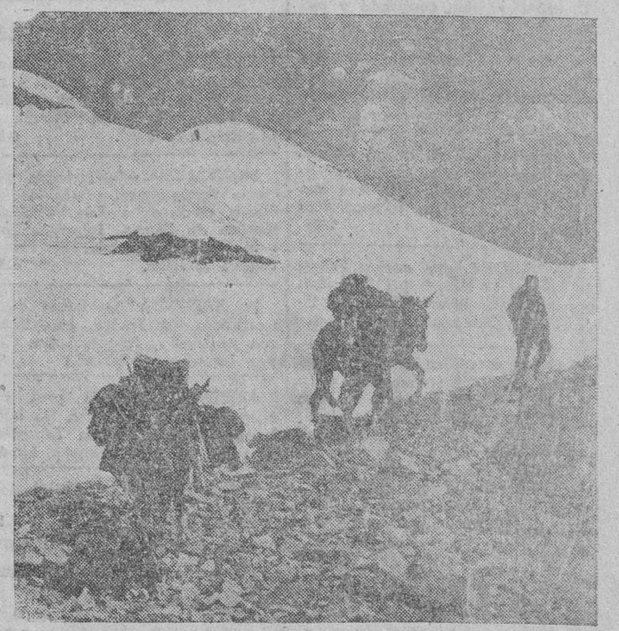
Los equipos alpinistas alemanes en su marcha por las montañas caucásicas