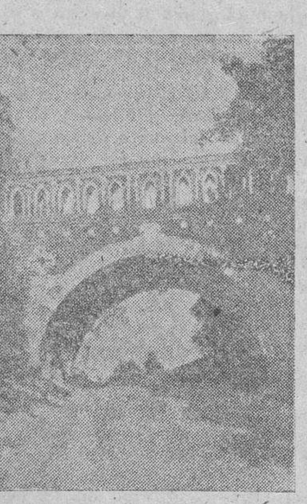
El puente de torrecillas de Stalingrado

3 de octubre, un combate naval ha tenido lugar, a lo largo del litoral holandés, entre fuerzas alemanas de protección y lanchas rápidas inglesas que fueron allegadas por el fuego eficaz de la artillería."