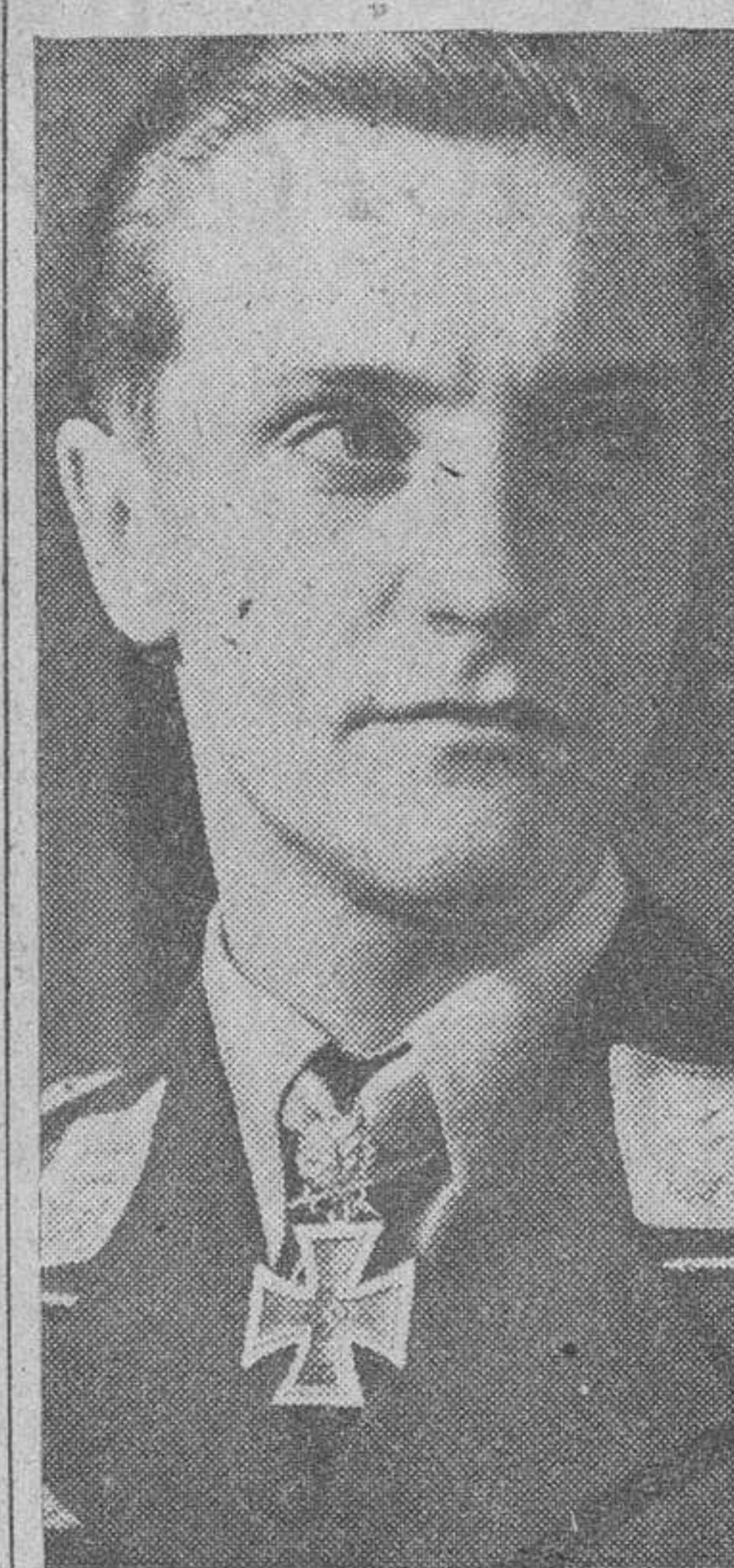
El capitán aviador Hans Joachim Marseille, que, tras sus 158 victorias, ha encontrado muerte gloriosa en tierra africana

MATRIZ Y PARTOS Consulta: A las doce Plaza del Corriño, 18. Tel. 2016