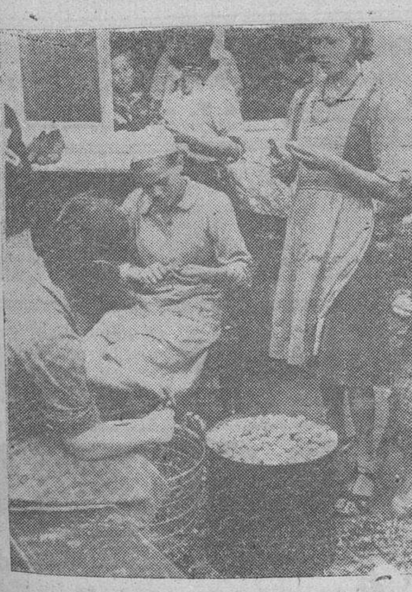
Jóvenes muchachas alemanas del Servicio de Trabajo se dedican a la preparación de la comida para los "soldados trabajadores" de la Organización Todt.