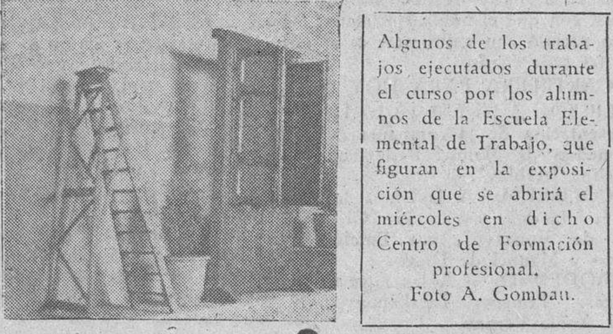
Algunos de los trabajos ejecutados durante el curso por los alumnos de la Escuela Elemental de Trabajo, que figuran en la exposición que se abrirá el miércoles en dicho Centro de Formación profesional.

la Elemental de Trabajo. Aparte de los trabajos y ejercicios que los alumnos se llevaron como recuerdo de su aprendizaje, otros quedaron guardados, como exponente de una obra meritísima y que deben ser conocidos por los salmantinos, e incluso por los que nos visiten con ocasión de nuestras ferias.