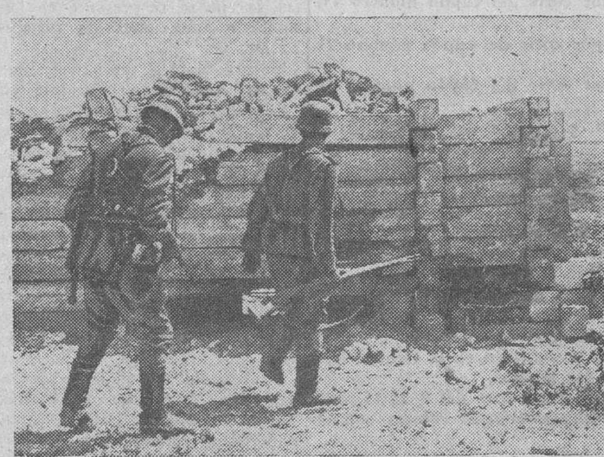
Soldados alemanes registran los fortines conquistados en una de las zonas caucásicas, donde se realiza el avance

La aviación inglesa perdió ONCE aparatos en el bombardeo de Bremen