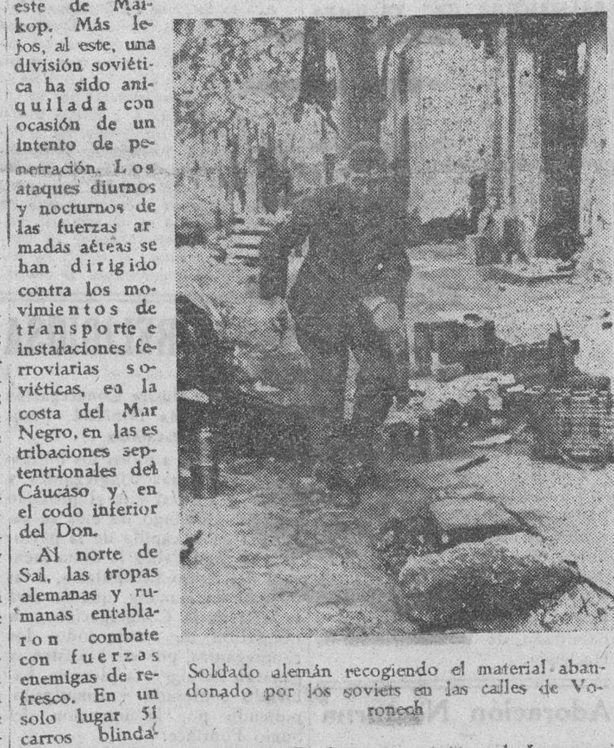
Soldado alemán recogiendo el material abandonado por los soviets en las calles de Voronezh.