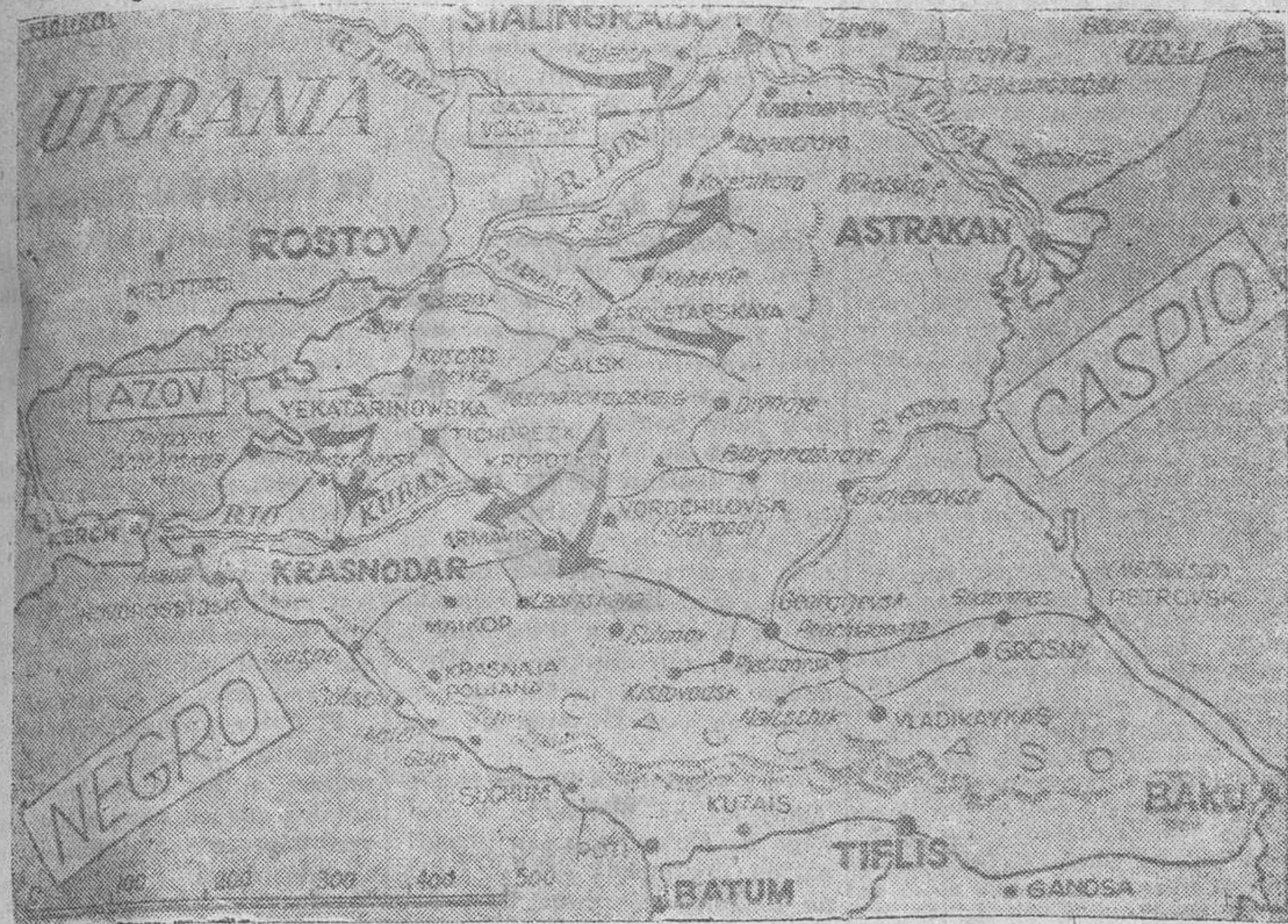
La amplia maniobra alemana en la región meridional del Don progresa en todas las direcciones. Las flechas de nuestro gráfico indican la dirección de las columnas de avance germánicas y los puntos donde se han producido los cortes de la única, y por tanto, importantísima, línea férrea que une el Caspio con el mar Negro.