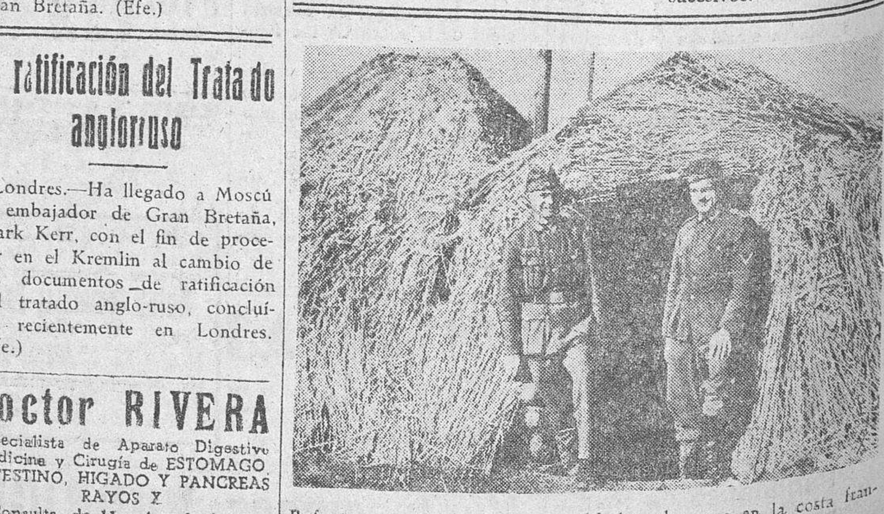
Refugios construidos por los soldados alemanes en la costa leonesa, desde donde ejercen estrecha vigilancia.

OBREERA: Cuando vayas a ser madre, acude al Instituto Nacional de Previsión. El Seguro de Maternidad te dará asistencia y pensión para compensar el jornal durante el parto y días sucesivos.