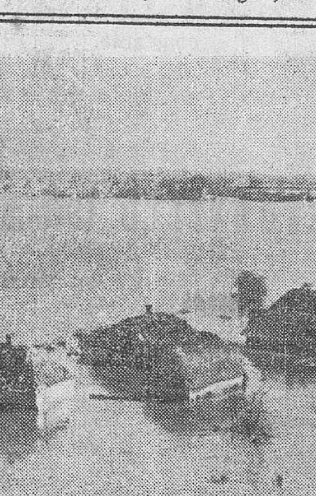
Un aspecto de la comarca del norte de Rusia, donde todavía hay un intenso deshielo.