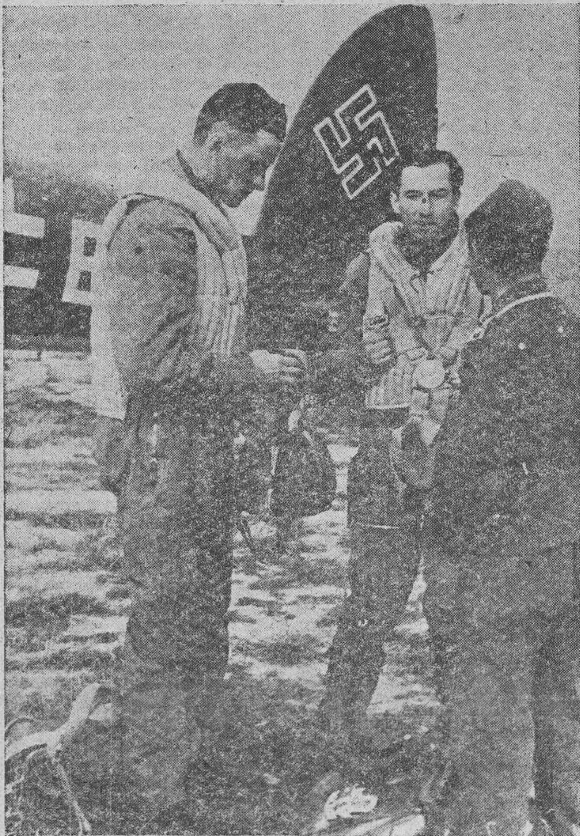
La tripulación de un avión de combate alemán regresando de un raid sobre Inglaterra, relata las peripecias de un combate aéreo